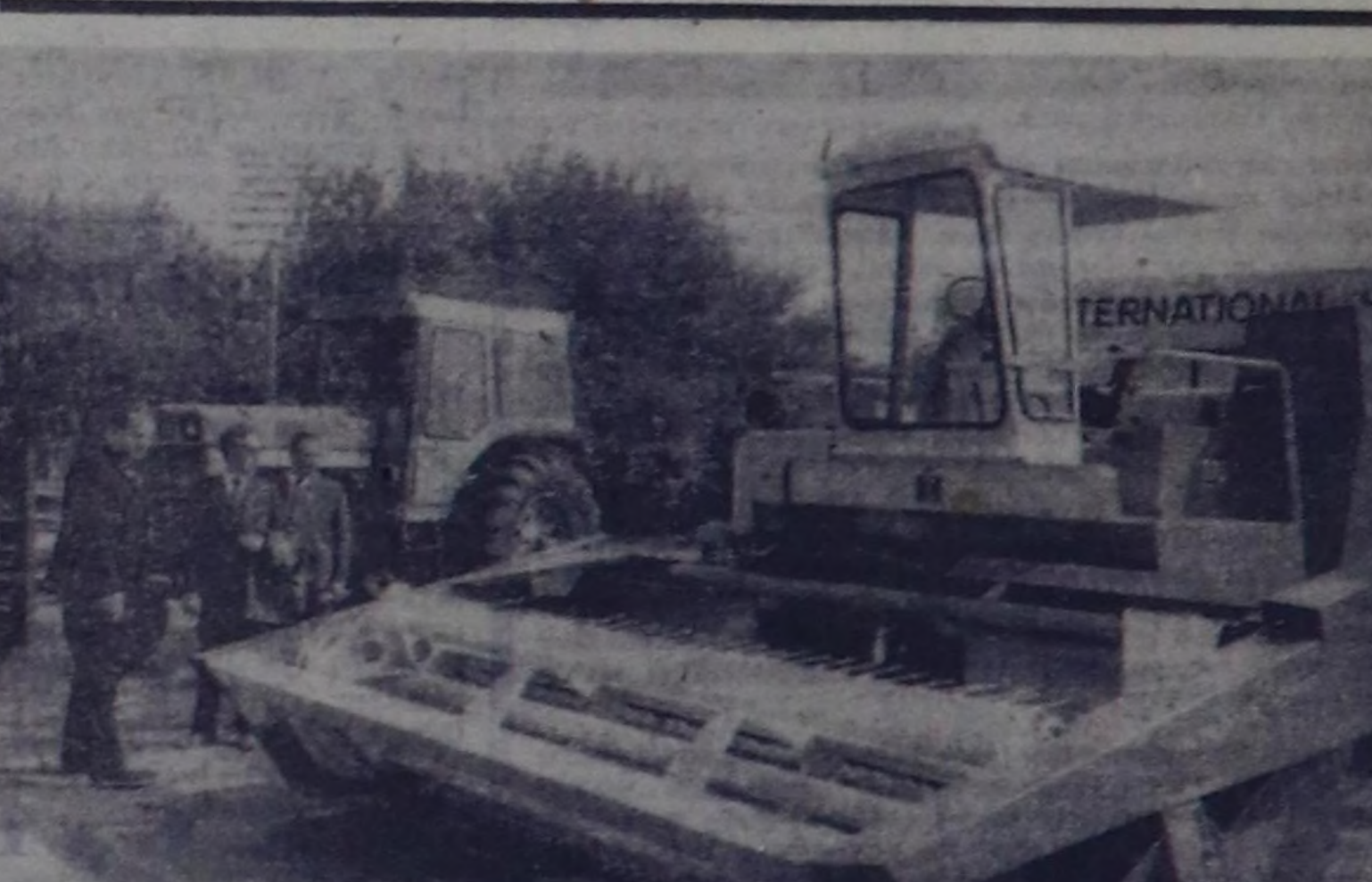
ЧУРУКТА: «Интернейшл» фирманың (АКШ) снген кондиционерлиг трактору.