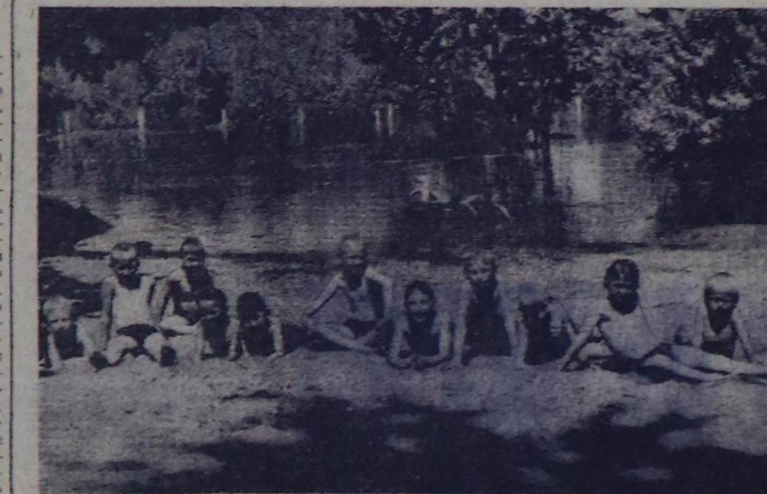
«Хүн-даа, суг-даа магалы-лаа».

Эркенниң колхоздар арзының пионер лагеря чурумалыг чараш Кара-Хөл деп чедир турар. Шыяал-ла, ол пионер лагеряның турар чери урулгарның дыштаныгына дык-ла таарымчалыг. Кара-Хөл белик тайгалар арзында ыгылакта, долганлар пештер болган яны-бүрү мяштар, үшүтер-биле хурээлеткенге. Чедиктерини хандыг дээр! Арыг агаар. Серины тайга. Хүнге кылаңының чыдар халте урулгар эштин ойнаар.