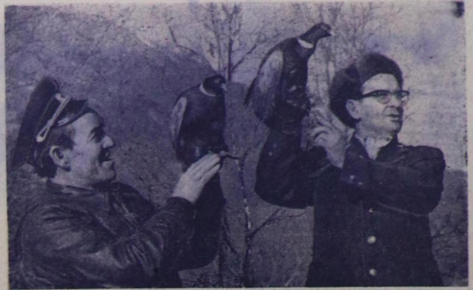
КЫРГЫС ССР. Алаартың кашпалында республикада эң баштайгы бойду суурларын тургузуп турар. Ол барың чээрби муң гектар шөлге чаптылар болгаш фрукчаларың даштанар деген чери алаар.

бийиктер болган дипломнар ол дугайың тодаргай херечилең турар. Москвада МАЧД-ге барган он-он муң кинилер приморукларың чогаалчы ажалдакчыларың танышаң: эрткин чылаан аңаа «Дүмбей тайга турган берде» база «Көрөң черивис-биле» деп кино-чуртукарың көргүсүңдөң. Студияның ит-сураа Төрөн чурттуң кызыгардырың бе-