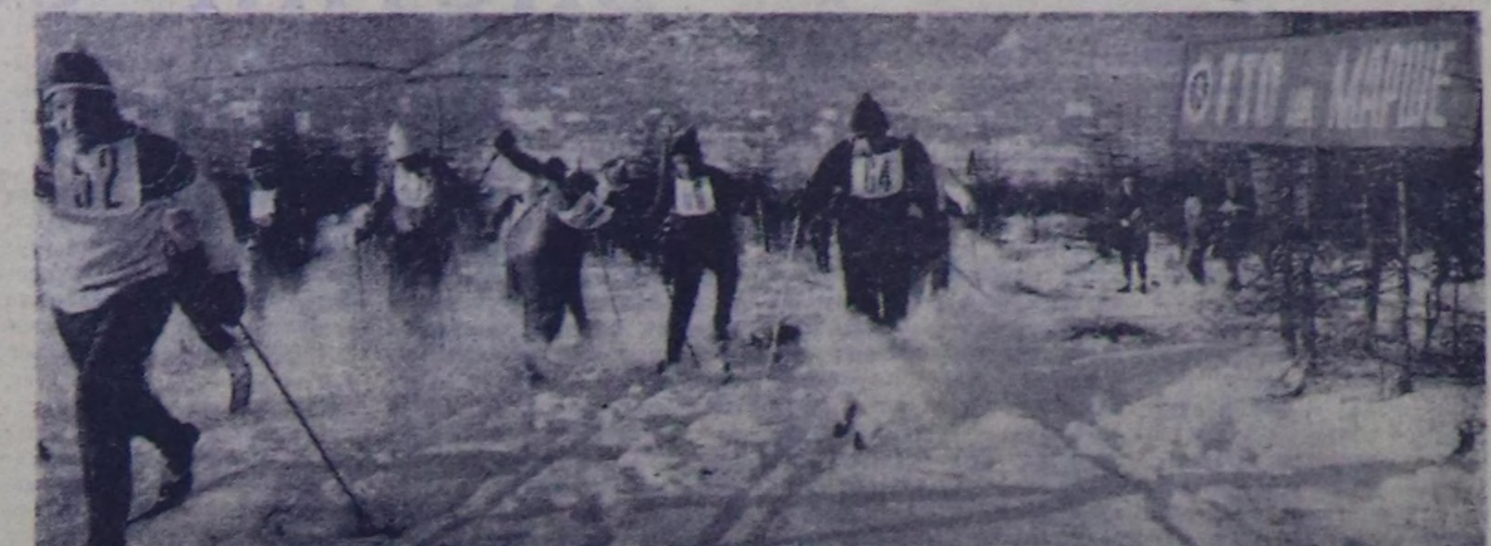
Магаданда кыш шуут кидин-тудук, ак хар чери шыва...