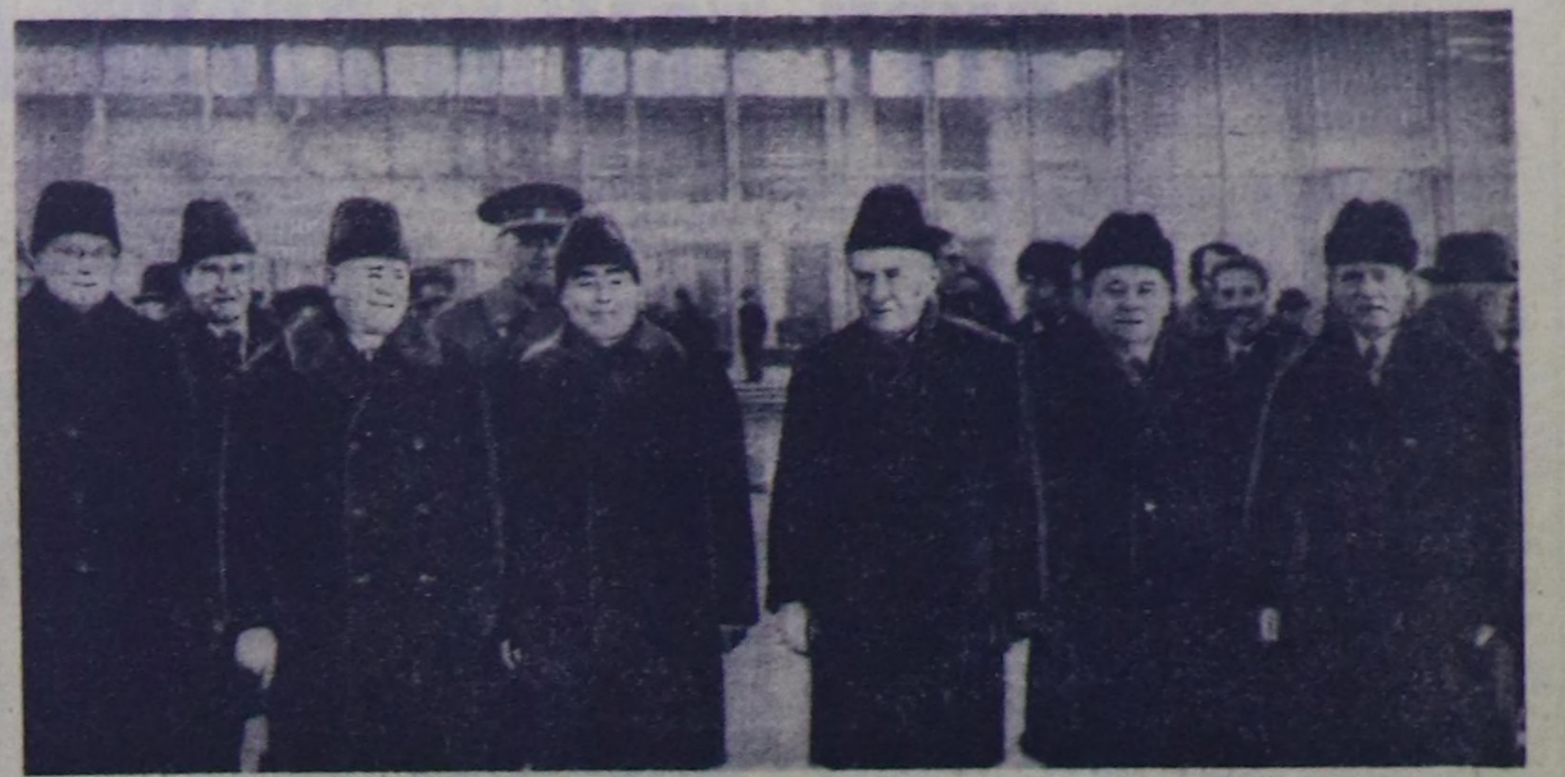
СЭКП ТК-ның Чингине секретари Л. И. Брежнев декабрь 4-те Москвадан Парижге чорупкан. ЧУРУКТА: Внуково аэродромунга үделге үезинде. (Чурукту фототелеграф дамчыштыр алган).