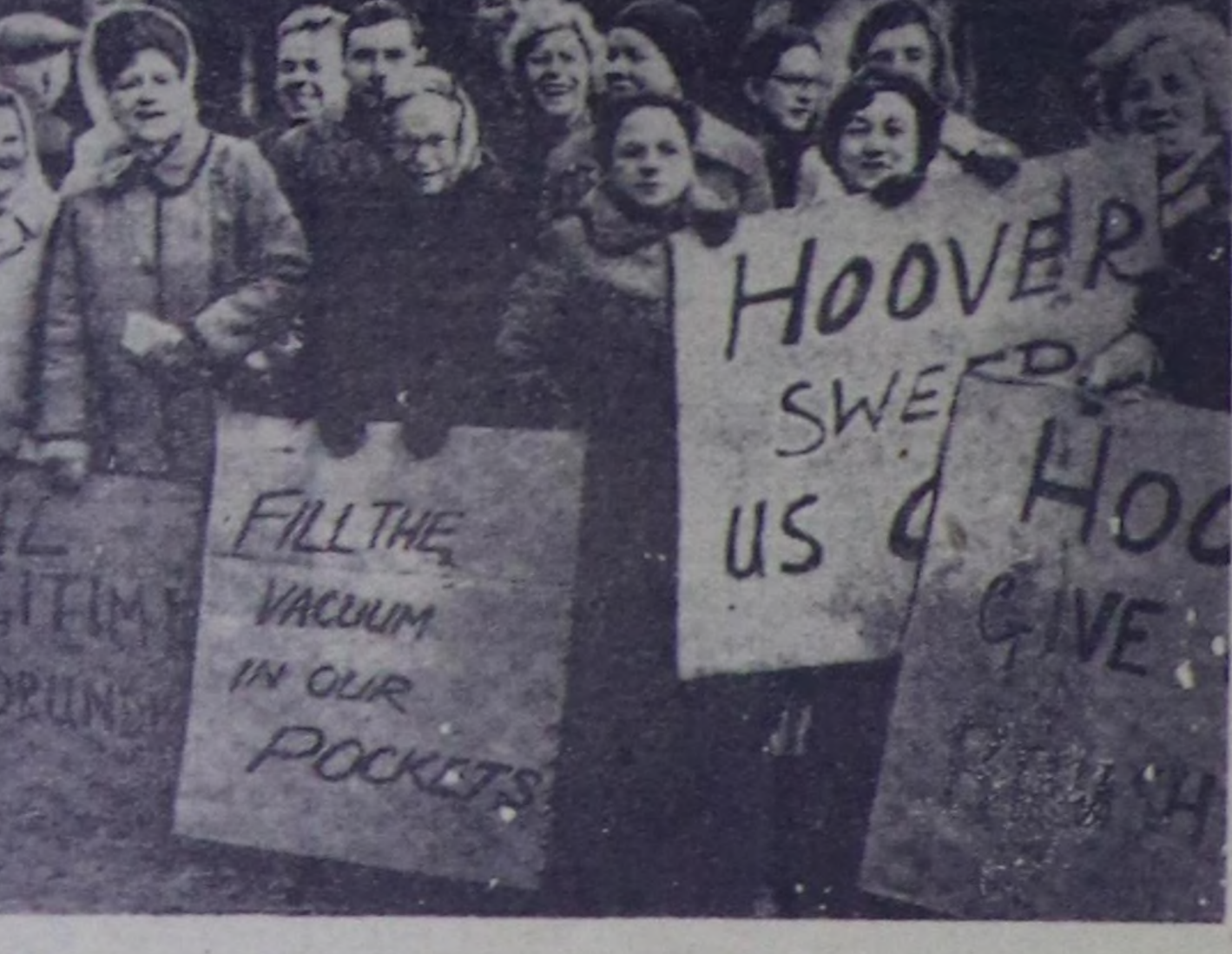
АНГЛИЯ. Лондонда «Гувер» компания-нын бүдүрүлгө чериниң ажилчылары ажил төдөриңиң улгандырып болган ажил-лаарың ителелдерин күтүлгөсүн чедиле алыр дээш ажил-ши сокуламыңкыңа кыла-ганар. Ажил сокуламыңкыңа шакты-таар дээш бүдүрүлгөңиң баштаар чериниң кылган бугу орадакчымыңкыңа бууран дүшкөт. Профешналиң бугу ителел-дерин күтүлгөсүн асха алыр ажилчылар иштинтерип-биле иделелденер. ЧУРКУТА: ажил сокуламыңкыңа төлө-лекчиери.

ТОКИО. (СЭТА). Японияга асха үнең хөвчөк күдүлдөш, саарылгада асха көстүп чор-бана хөмчөлдүг көвүдөн. Япон банкының динчаканым булгаар алдыга, чүтү-бүрү үлөтүп асха саны эмге-хала-жок — 3,5 миллиард болурун-га четкен. Чингелет сайзы көрөгө, Японияның ам сары-у-гада бугу асханың чангыс чег-зе бөсө салыңар болза, 340 километр бедик бөрү кийик. Японияның эң бедик даа — Фудзиямадан оон бедик барык 90 катан аажык болурун. Японияның чаалааны он муң иена үнең савзын асха үндүргөніңиң соода 16-ла чыл өрткөн. Ол асхалар бугу са-зын асханың 80 ажыг хуузу бооп турар-даа бөд, асха саа-рылганының чогулгалыг болу-рун хандыра албайн турар. Ам оон-даа улут үнең савзы асхалар үндүрер дуга-йында уугаалар динчакан ту-рар аларган.