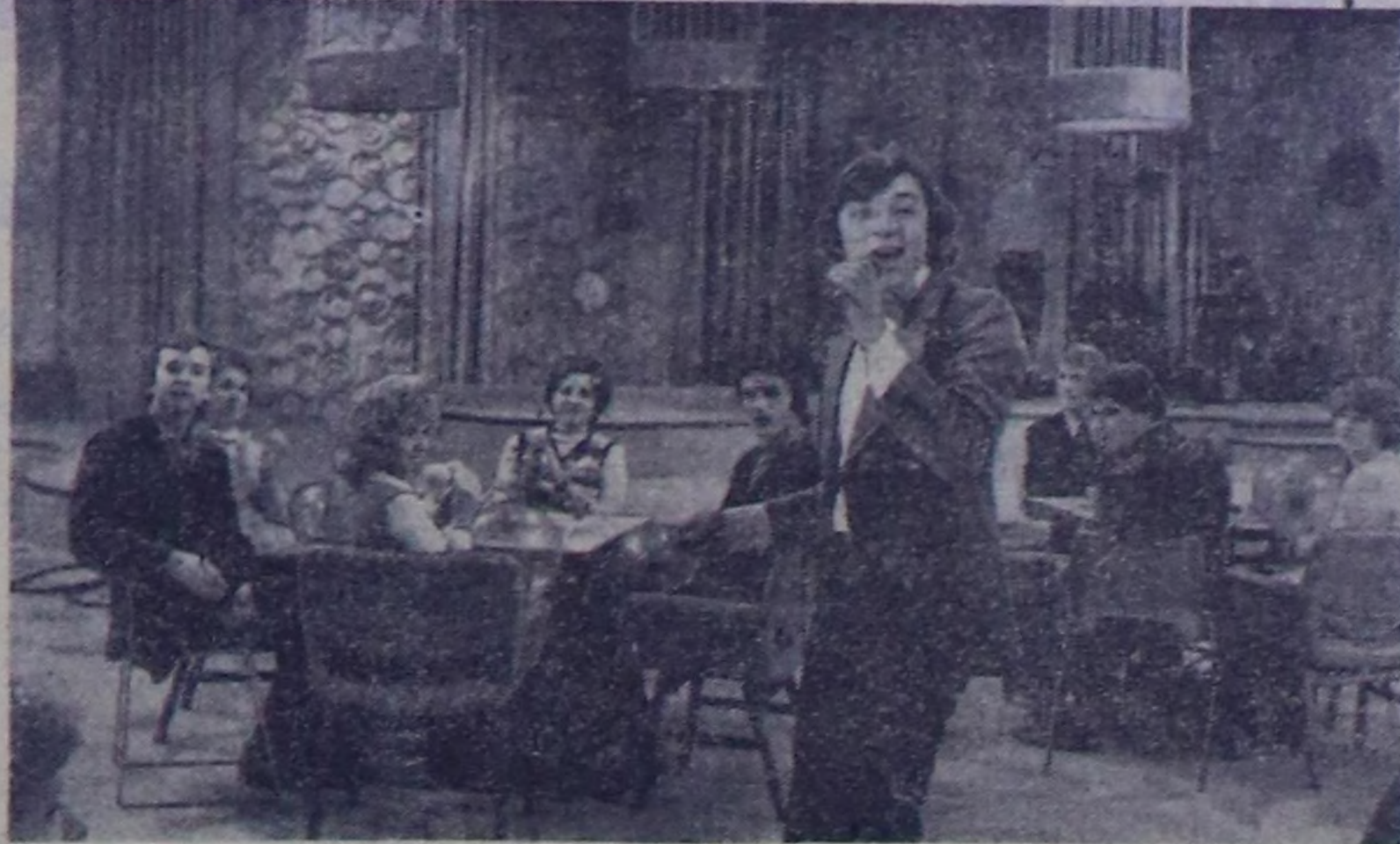
МОСКВА. Чаа чылдың чаңчыма болу берген «Ак-кох от» деп теледидымада — өңне солунарының бирээни. Бистиң чурттуг бүтү булдуларында оон-он миллион кижилер ону көөрлер. Моон кадым-даа дамчыдылганында холгелди, үрлары, каткыны, баштаканышкыныны корукчулар со-нуургалар. Бо программаны тургузучу болук-биле кады режиссер Э. А. Озерная болгаш редактор Н. Д. Нестеровская олар белеткен турар.