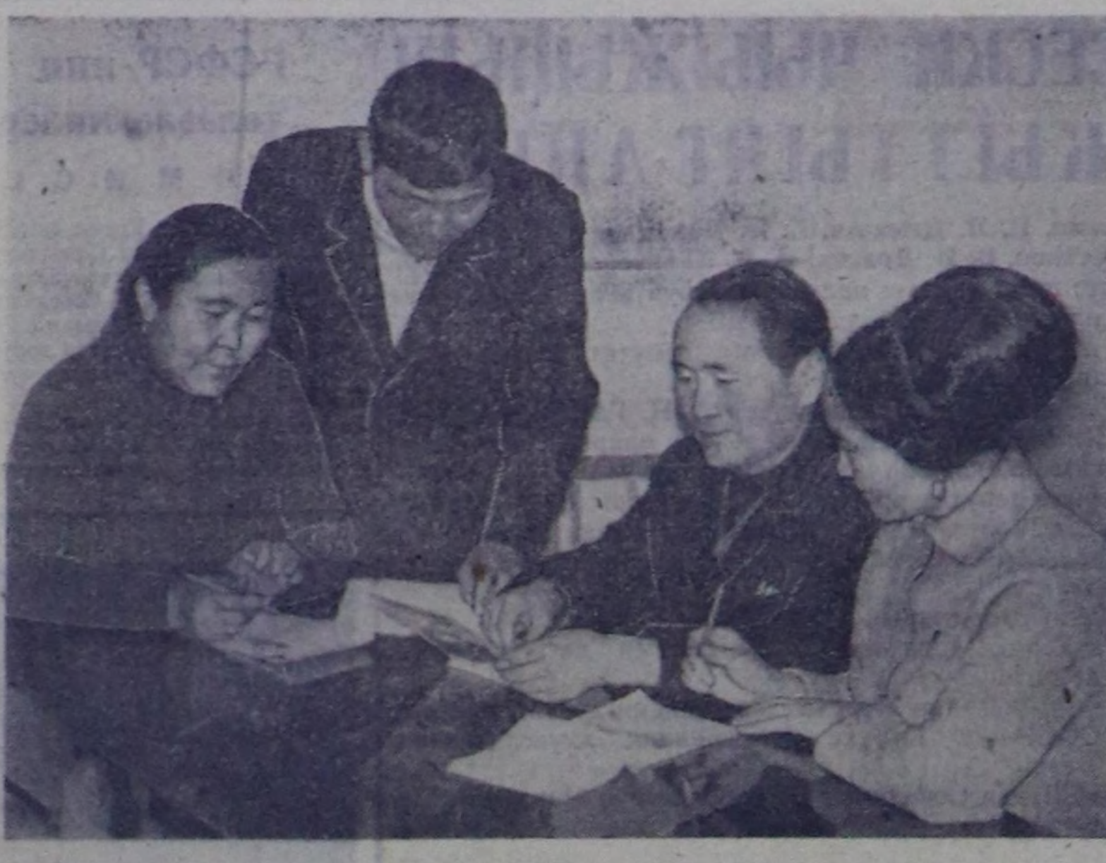
«Билиг» нитилелин район организацианын баштаар черинин харысалгалыг секретары.

Делегей байдалында болгаш шериг-патриоттуг, аныктарын аажы-чаң кижизилдеңизинин, педагогиканын, литературанын, уран чүлүдүн болгаш күрүнө, эрге-хоолуунун темаларына лекциялар эвээш эвес номчуттуган. Илчала-даа аныктарын совет патриотизминин болгаш пролетаржи интернационализминин, коммунисттик моральдыг норма-чакыктеринин бугуруу кижизилдин тарыхынын четпесинде районда 200 ажыг анык кижилер ортумак эртем чедип албай. Эртем-атистиг темата, күш-куштурга болгаш спортка, эртем-техникага холбашкан лекциялар эвээш номчуттуган. Ол четпес. Бистин уевис-кижилеринин мага-бот, угаан-бодал, эртем-техниктиг депшиге талазы-биле бедик сайыралдык үеин, илчалаган ол темаларычче моон солгаар шыңгым кижизилдин салды негетинип турар. Бистин районда лекция пропагандалыг калбарып чорудулуң аргалар хей: төптүтүмүн бригадаларын чугаллааска, кызыл-булдуңнар, кедээ