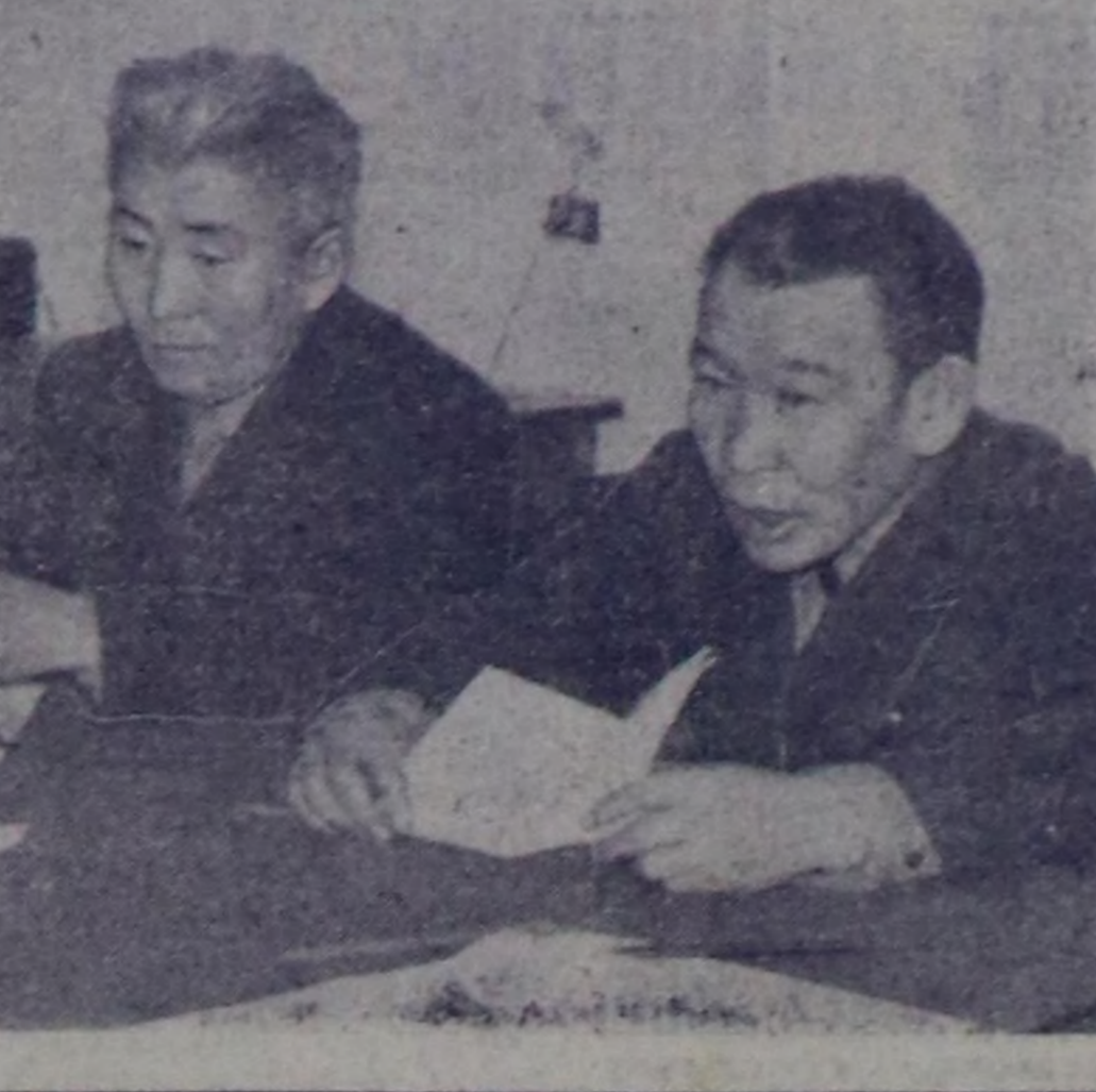
Харым: Школада бугуруле өредилгезинин байдалыг.

бооп турарыг? Харым: Бистин суурга чүдө 25 орунуг тургалар сады бар. Оон чылда 5—7 хире уруг бирги класска баар. Ынчанга амыдырында шунту уругларын чүдө белетке калдыгына дуза хой школалар кырышкен. Доктаамал амылданчылар турар, таарыштыр кылган туралыг, бижыг-латтыгын черин, техникалыг бугуруле бригадалыг бисте чок. Оон чылдагынын ийн талалыг. Бир-ле, «Тээли» совхозтун салбырынга тургустунган. Ук амык ала-башкарыйлап турар. Совхоз-башкыларын чырып, бугуруле бригадалыг амыктыг болуру чотуру-биле чоруур алаар бис.