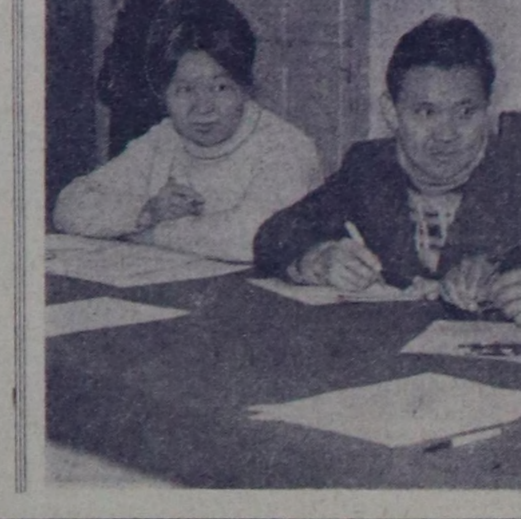
Харым: Школада бугуруле өредилгезинин байдалыг.

Республиканын чамдык школаларынын класстан дашкаар амылданчылары-биле «Шын» солунун редакциясыга амык чугаа болган. Орта бүгүн-ити ортук өредилге ишчилерин, доозарынын өредилге-кыжжидыг амык амылдары-биле холбарынын, кезде школаларда өредилге-кыжжидыг амыктыг дегендеги улам беддеринин айтыргалары тургустунган.