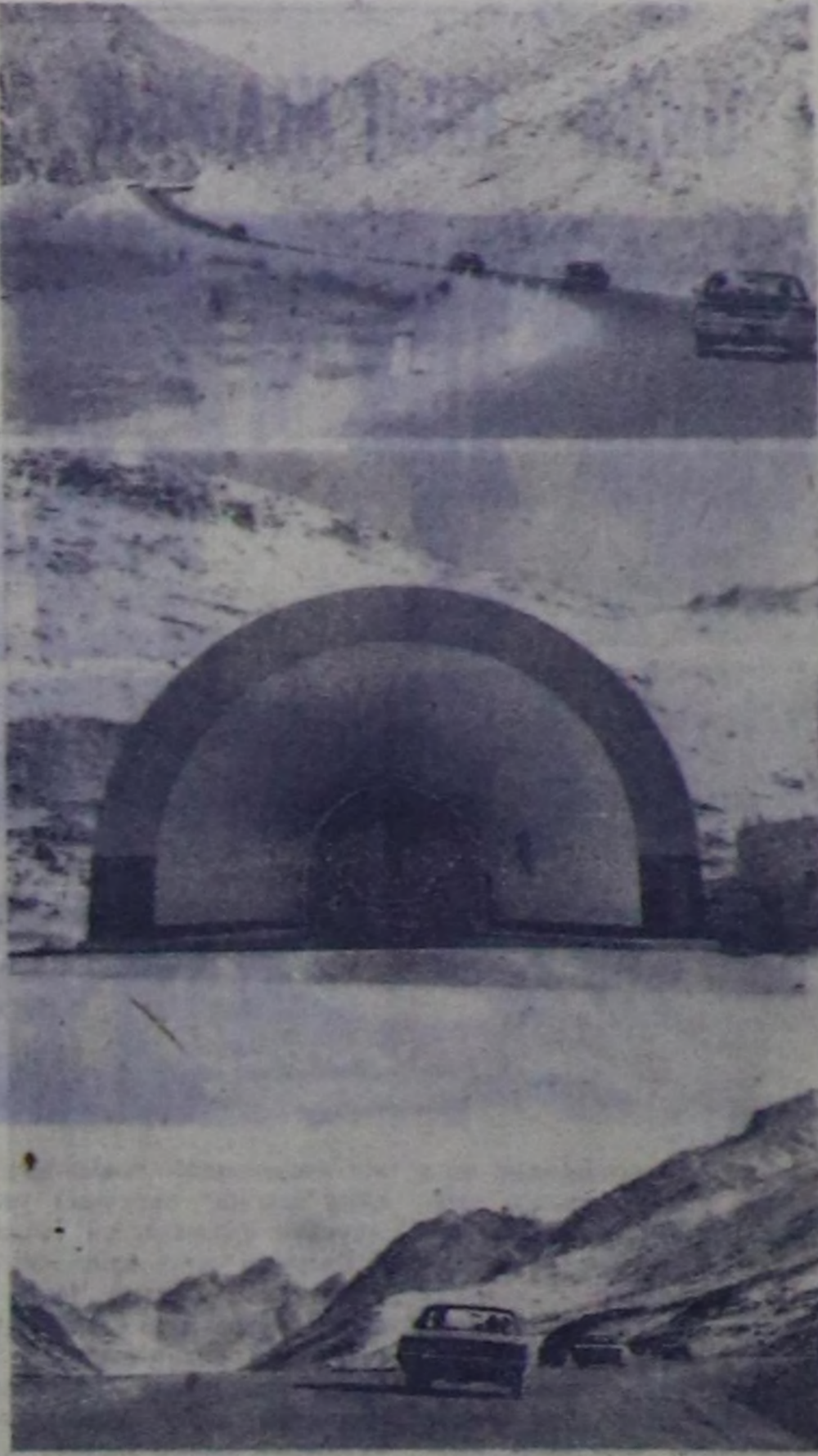
Набулдан СССР, Иран болгаш Пакистан талазын амы үеиниң төргин эки чазалыг автостроу шөйлүп чоруткан. Хэмээрлашкы чорутуу Афганистаннын чедип алганын сонда ийнде кылган ийн чартын муң аягы километр бетон-асфальтлыг автостроуну бадур-чартын муң километрин тударына Совет Эвилели дузалашкан.

ЧУРУНТА: совет специалисттерин дузаламчызы-биле Набу-Шерхан аразында кылган автостроунуң бир көзү.