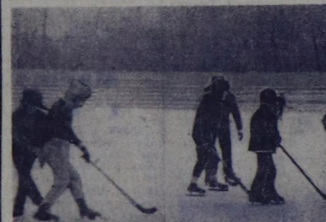
Культураның болгаш дыштанылганың Гастелло аттың паркында «Хуреш» стадионунда дыштаныр хуннерде, ажылдан хосту шактарда хөгүс-ле. Аңаа школачылар болгаш анык өскөн хоккей ойнаарыңа ынактар.