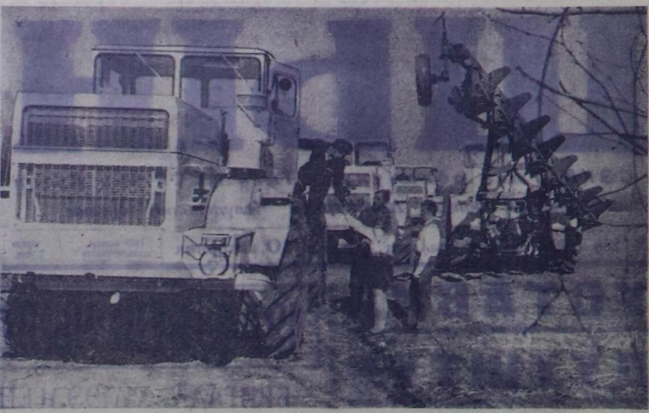
Ленинградтын «Кировский завод» наттыжышынын дуржуга сегинге септелге черинден чаа хевирин «К-701» дээр үш чус айт күштүг тракторларнын баштайгы бөлүгүн кылып ундурган. Ол машиналар тоску беш чылдын (1971—1975) доозуну чылында наттыжышынын амгы үдө кылып ундурган турар «К-700» деп тракторларын солугур умурлуг. Совет кездэ ажал-агынын механизастарына болгаш интенсификастарына, чер ажалын техниктиг нуулу-туралын улам көндүрөнгө он-он муң «Кировецтер» чугула ролдуу болган. «К-700» дээр тракторларын даштын чурт-тарда баш дика хереглөп турар.

«Ден-Терезия», «Барык» совхозтарда чамдык бригадалар парторганизациаларынын ажал-ам-даа чогур бедик денелге чедир тургустуулаш. Хурадалар өрттирер хуусааны сагынас чоруктар, чамдык коммунистер партиянын болгаш куруенин сагыла-чурумун үрөөр, бүдүрүлгө авангарды ролун көргүсөсө фактылар ам-даа унуткатынмай.