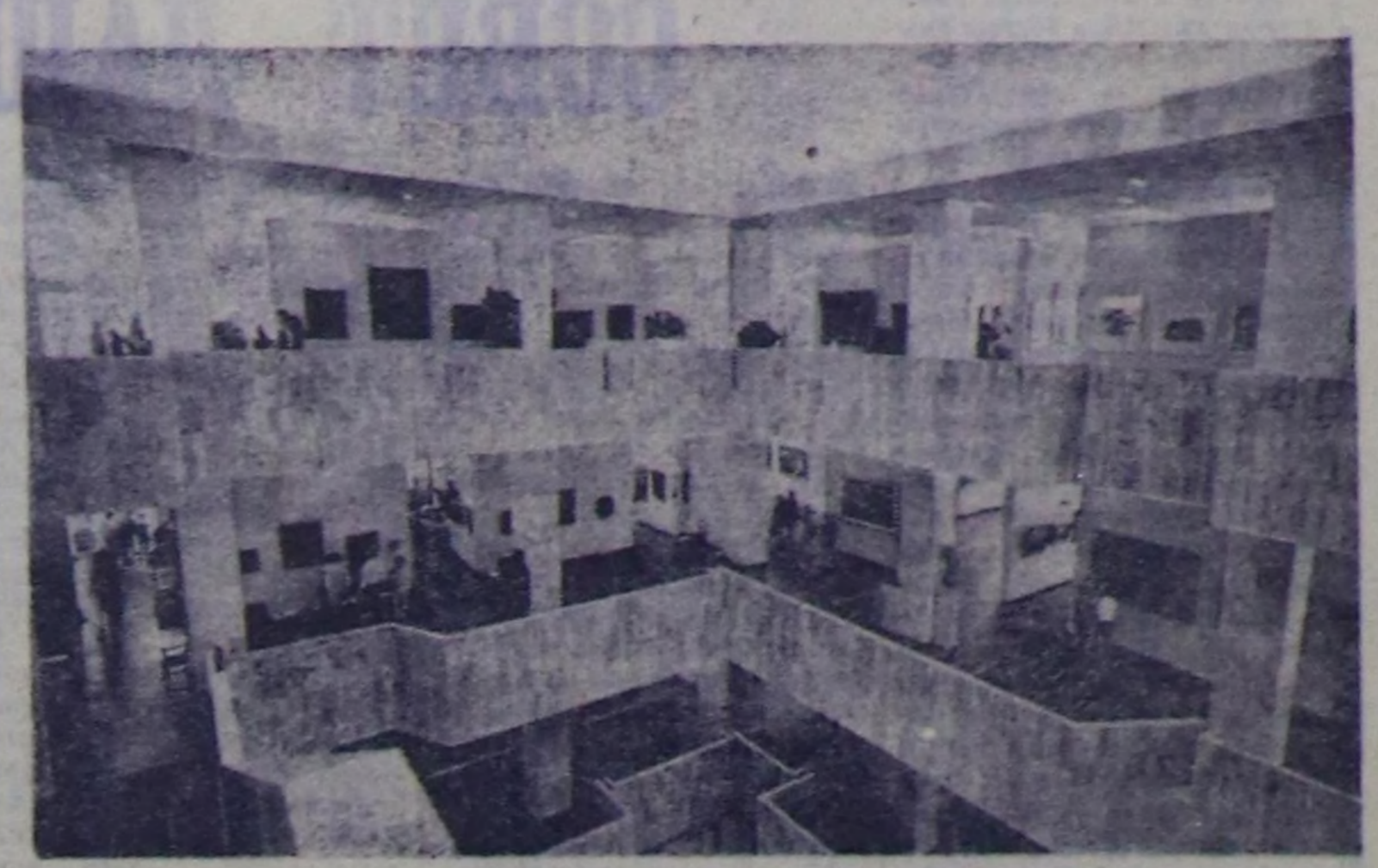
Узбекистаның найысыялында Уран чуулдуң күрүнү музейи чаа бамыче көмүл кирген. Ол — Узбекистаның 27 музейлериниң бирээзи ол.

Чаагайжыдылга талазы-биле чедир кылдынымаан ажилдар бисте ам-дас көөй. Чөзө, Торгалыг суурту «Комсомольская», «Малык», Чаа-Суурун «Найырал» кудумчуларында чаагайжыдылга ажилдары чорутур пелелдеген чөтөйи турар.