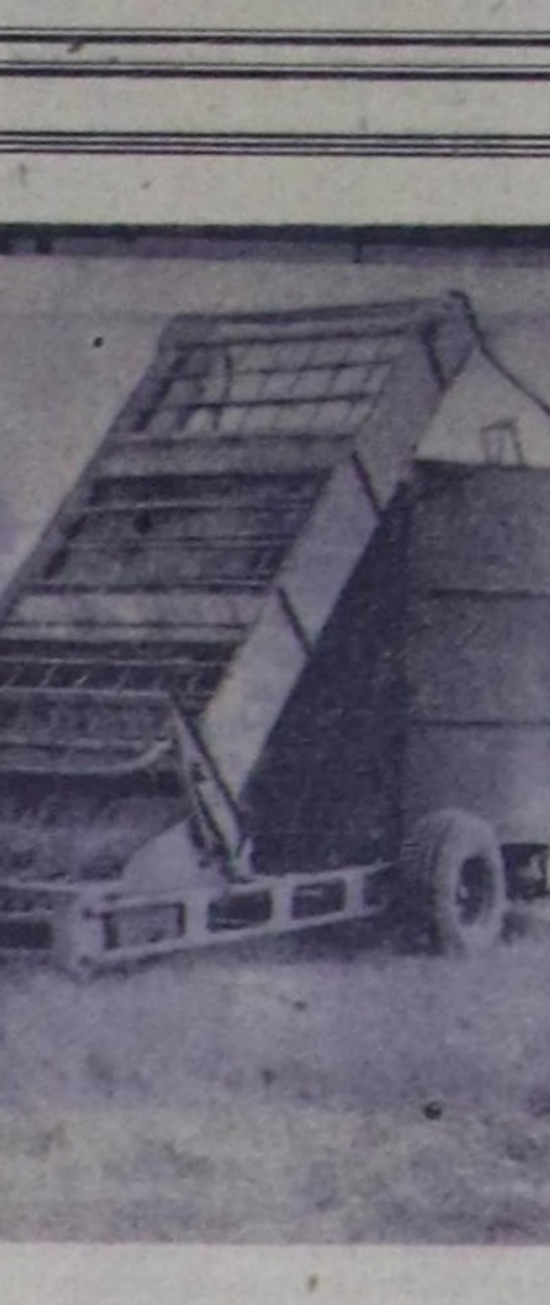
ийги арын. ● 1974 ч. август 20