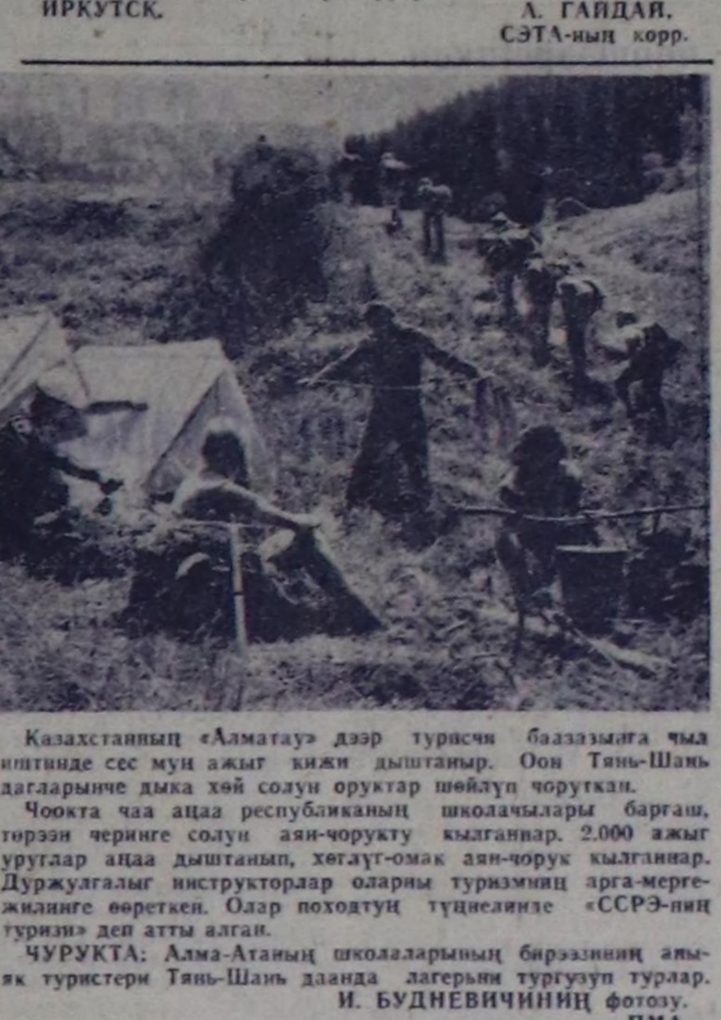
Калхастаның «Алатау» дээр турарын баазылыга чыл итинде сес муң аягыт кыж даштарын. Оон Тянь-Шань дагаларыне дыка хей солуу оруктар иштелу чоруткан.

Иркутскиде эртөөн чүс чылдың ортан үезинде декабрист Сергей Григорьевич Волконскийниң чурттан турган бажынын чаартыр ажилдар эгелей берген. Ол ийи катт ыш бажың Тимирязев (биеде Преображенская) кудумчуларда ужула турар.