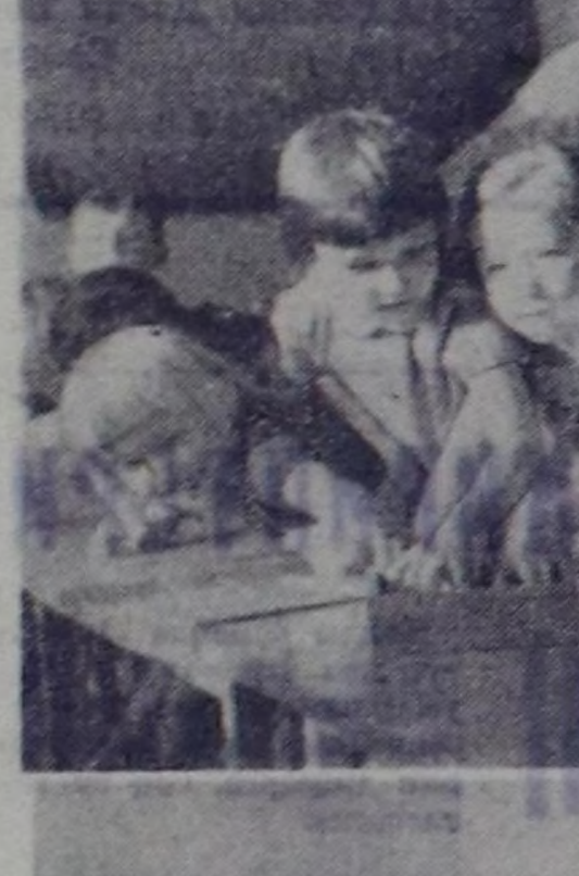
Чалыңда — хооромчул, хоор-куссомчул бажыңы. Кы-рымда туң кинескэң, тыва өг дег оваадылгы бажың чааа бажыңы деп дем-не чуугааладым. Оон мындаа эрик кидымында ак со-гун «Аянның төвү» деп ту-раскаалдыр. Оон адаанда кы-зыл партизаннар турсакала-ны чуве. Солун, солун харин өн-нүк. Аянның төвү бо улуғ дилитиң ийиңи-бир өскө чур-тулда эвес, а Россиянык анык республиканыкы найы-сылалында болганга чул-ге кызылчылар эвес, өскө-даа кийилер өртүрү чуве.

Адаанда чурунче кичээ-гейнер хөгжим кичээ са-