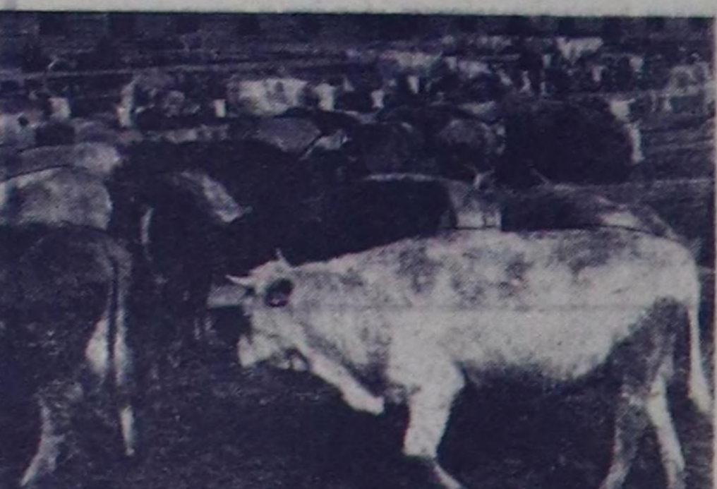
Чугаалажып турар. Устуңу — семирти азыраалда шарыжыктарын инити чем саванындан чем чип турары.