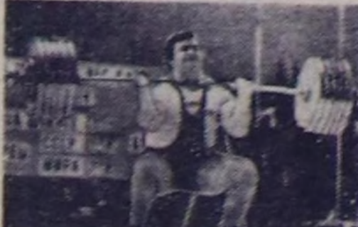
Мюнхенде олимпийск суурга болган таварылга холбоштар кылбас эвес.

ССР-иниң электеринин Польшанын коомандасын шүдүкчүлөрүн аки чыгып болган дээр чутулап болуп. Чүгө дээр, алаа по-ляна спортсменер тилдөр болза, олимпийск чемпион-пары удул алган дег ма-дандыр боорлап башка, чүгө-дөө болбос турган. А совет шилдик коомдага ол оюу — тержин удуз укур-дузалык болган. Олар тилдөр болза боттарынын бөдүлүгө бирги чеге укур укурдул. Иччала-ла-лаа поляна спортсменер тержин аки ойнаанар. Бичанган бистин коомда-нык бүгү-ле күжүн салыр, бяр-ла аргаларын амыкылар укурга таварышкан. Оларын маргыдалаы уш шак амык чеге үргүзүлгөн. Оон түнпөк чүгө соолту укурдул-кыны — бешки ойнакыла ийн шарттыктын. ССР-иниң шилдик электеринин укур укур-жышкынын укур арым-биле уткыш, боттары-нын бөдүлүгүн бирги чеге чеге үгөн. Сентябрь 5-тиң кижик маргыдалаларын олимпийск суурга болган таварылга холбоштар кылбас эвес. Бичанган сентябрь 6-тын маргыдалаларын эрген аес, а ук чегин-биле 14 шакта эгелерин чараан.