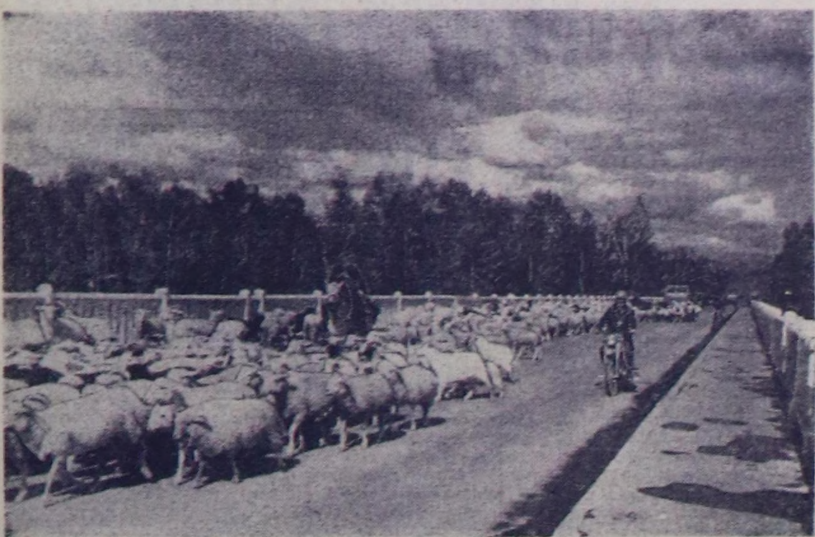
Тыванын делгемнеринде. Хемчик көөрүрүм күзөгө көшкөн аалдың хою кезип олур.