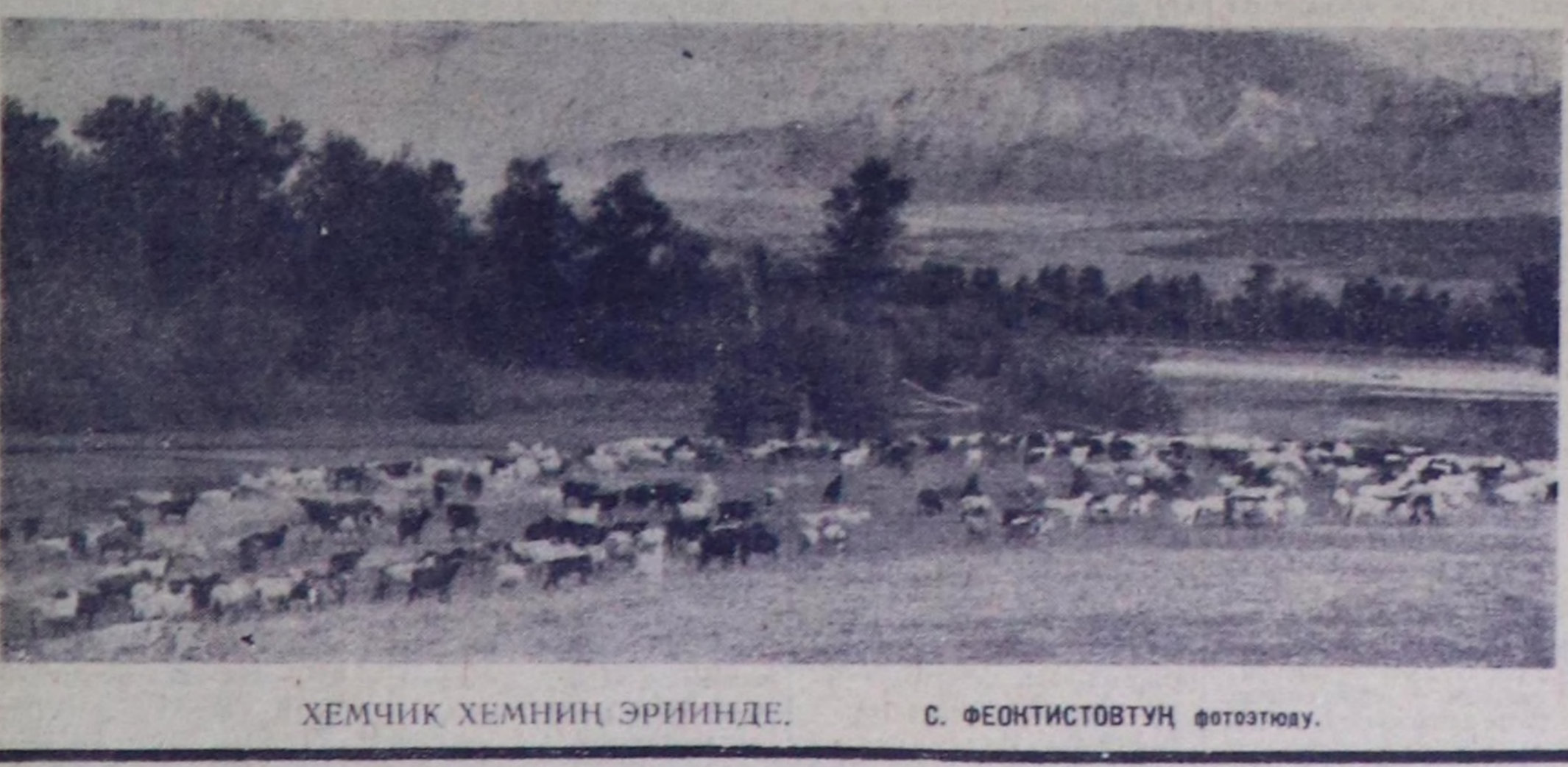
ХЕМЧИК ХЕМНИҢ ЭРИИНДЕ.