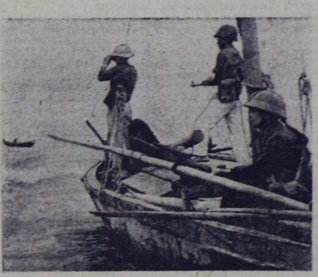
ВДР. Тханьха можунуң улусту ополченезиниң хемнер болган далайлар эриктери камгалаан отрядтары далайке балыктан чоруткан балыкчылар-ны агресорнуң хенертен халлаашкынарындан серемчиледиг камгалап турарын бо чурукта көргүс-кен.

СКОПЛЕ. (СЭТА). Шыдыраа олимпиадазының илги айынышымыңда Данияның коман-дазы-биле ужурашпачын, СССР-нің шпилдик коман-дазы база катар уруг тивелде-ни чөтөп алган. Ужуралышы-нын салгы 3:5:5 болган. Смирлов Хемьяны, Таби — Янжесонну, Карнов — Салтук-удун алгалар. Савон биле Холмич ужурашышыны хайым болган. Ам бистик шыдыраачыларымың 7,5 салгы.