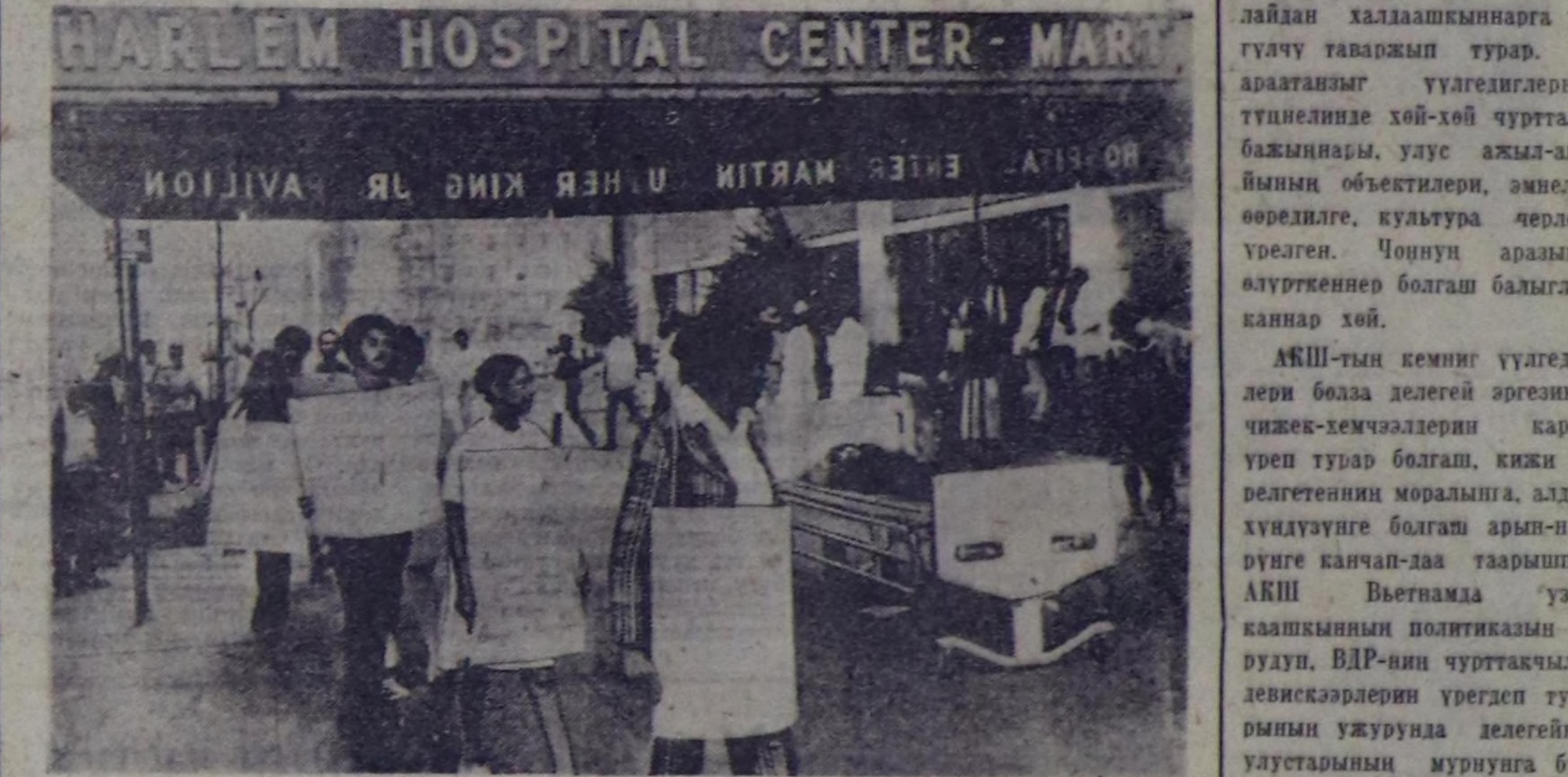
НЬЮ-ЙОРК. Каттышкан Штаттарын иер чоңу ядарага, кылар аймактын чонуга, кеш-соок ягаар дорамчылалга улту демиселин солбостайн турар. НЬЮ-Йорктун Гарлем кварталында медицина хандырылыгы чамдык-на улам дорапайл турар. Мыда чонун аяр-аржыкка туттурарын, уруларын өлүп хорарынын хууу ол хойларын оон өскө кварагаларындамын оранчок хөй. ЧУРГУКТА: медицина хандырылыгы экижестери Гарлем кварталын аяр-аржыккеринин болган эмнеде аймакчалык нере турары. (СЭТА-нын фотохроникасы).

ВДР-инч өөл өскө ош-он хойларын агарлау болган далай халлаашкынарга ургудуу таварыштыр турар. Ол арастанып үлгелеринин тундунде хой-хөй чуртталга бажынарын, улту айма-айларын объектилери, эмнеде, өөрдилге, культура чедери урген. Чонун арамын өлүрткөн болган балыктын каннар хөй. АКШ-тын кемин үлгелерини болза делегей эргезинин чижек-хемчелерин каржы урен турар болган, кийи төлөгөтенин моральна, адал-хундууниге болган арым-нүгүруге канчап-даа таарышкын АКШ Вьетнама улту каакшынын политикамын чорудуун, ВДР-инч чуртталык девискарлерин ургезген турарын урунда делегейин ултуларын мурунга буту харамааланы хуаар ужурун деп, дөпч угуугада чугаалаан. Америк дайынарлардын илжинг эөө үлгелеринин шыгыны буруу шарваринче делегейин хой-нитизин угуугада кийгирган.