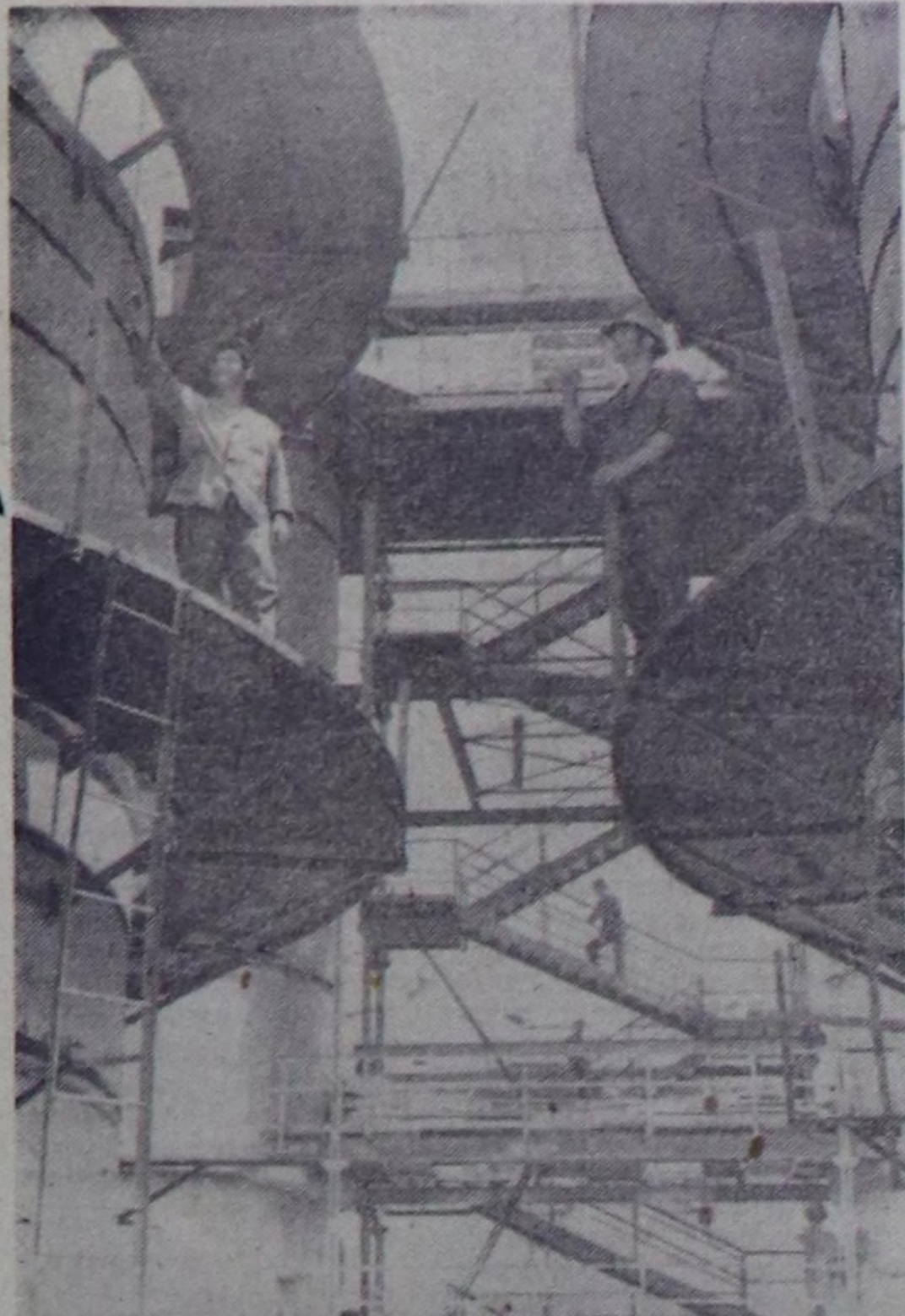
БОЛГАРИЯ. Химинтик чемишчилгелерини бугуверинин талаа-биле Европада эц улуг дээн комбинатты Варнаның чогунада Девнен шынааында тууп турарын бо чурунта көргүскен...