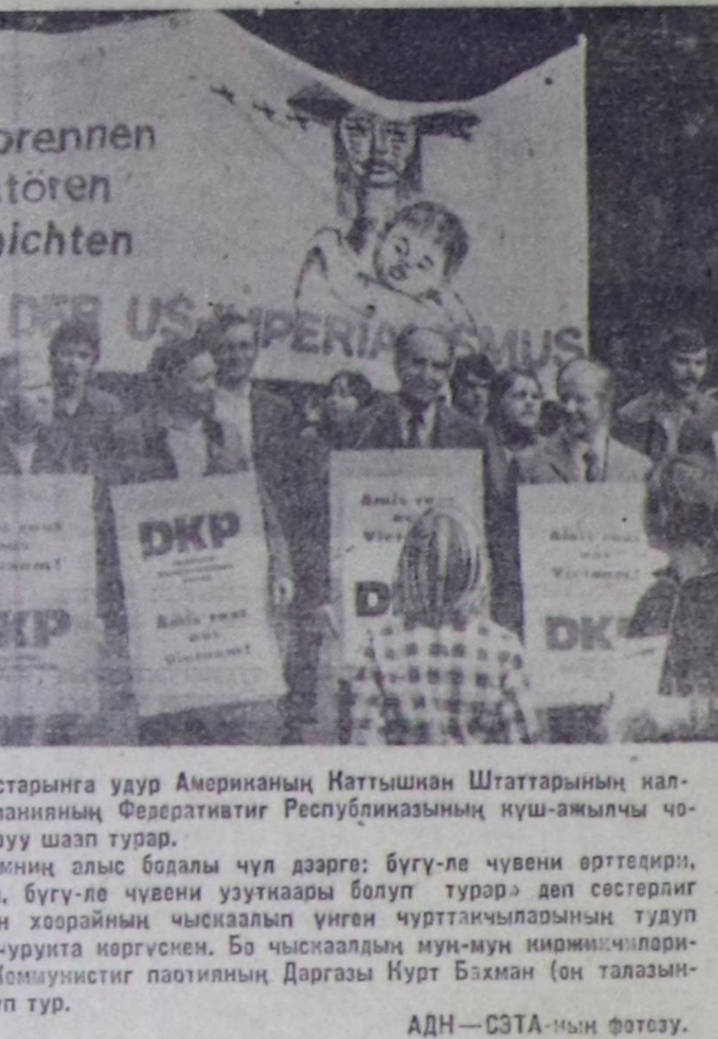
Индий-Кыдаттын улустарына уду Американың Каттышкан Штатарынын калбарган агрессиянык Германияның Федеративтик Республиказынын күш-ажылчы чо-ни инкелдизи-биле буруу шаап турар.

Таджикистан — 513 катан, Армения — 527 катан, Молдавия — 532 катан, Казахстан — 601 катан көвүдөткен. Экономика талаа-биле хоужулангай чоран национал кыды-кызыгаар черлерини индустриалдыг болган культурул дүргөн хөгжүлдөз Совет күрүнеин болган элөөн сайзырагай улустарын, илангыя өсүс улустун аажок улуг дузалачымын ачында харын чедип алдынар аргады болган. Калдар-биле, материдалды курлавырлар-биле болган өске-даа чүүлдер-биле дузалал келген. Агы-туума өске-даа республикаларга хаммаарыштыр индиг саннары болган фактыларын хойну-биле көргүзү болуру. Совет Социалистик Республикаларын Эвилели кылдыр боттарынын сыры каттышканы калдык байлак үрүткелдериниң бери турарына, ол сыры каттыжышкын келер үеде калдык калбак аргаларын ажимды турарына бистин чуртувустун бүгү улустарын хой чылдары амыдырачы дуржулгазын улам бузурун турар. И. ПАВЛОВ. (СЭТА).