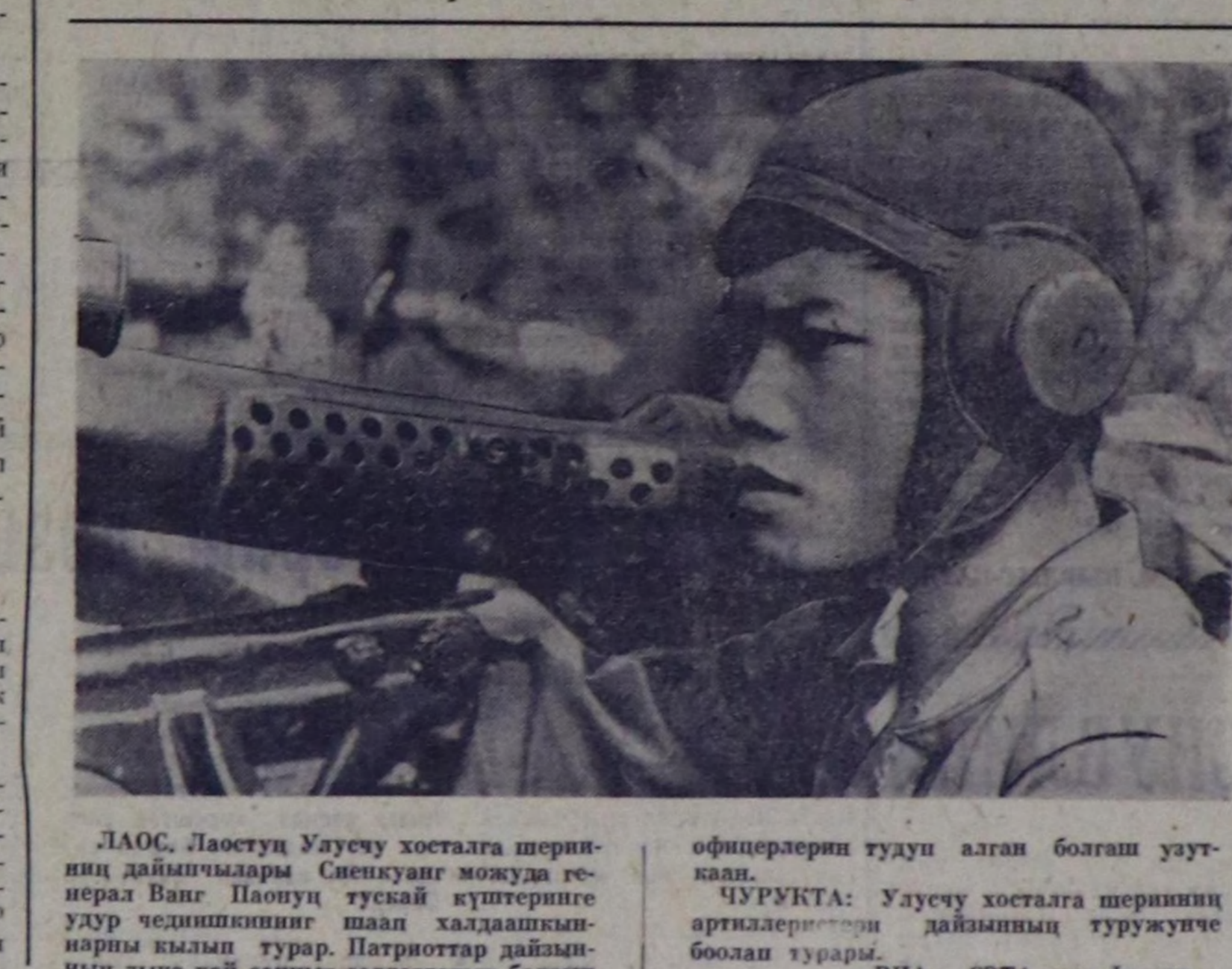
Лаос. Лаостуг Уаучу хостала шериниң дайынчылары Спенкунг мокуда генерал Ванг Поауц тускай күштеринге уаур чедикшиктин шал халдашкындары кылып турар. Патриот дайынчы дика хой санын создаттары болган офицерлерин тудуу алган болган уаучукал.