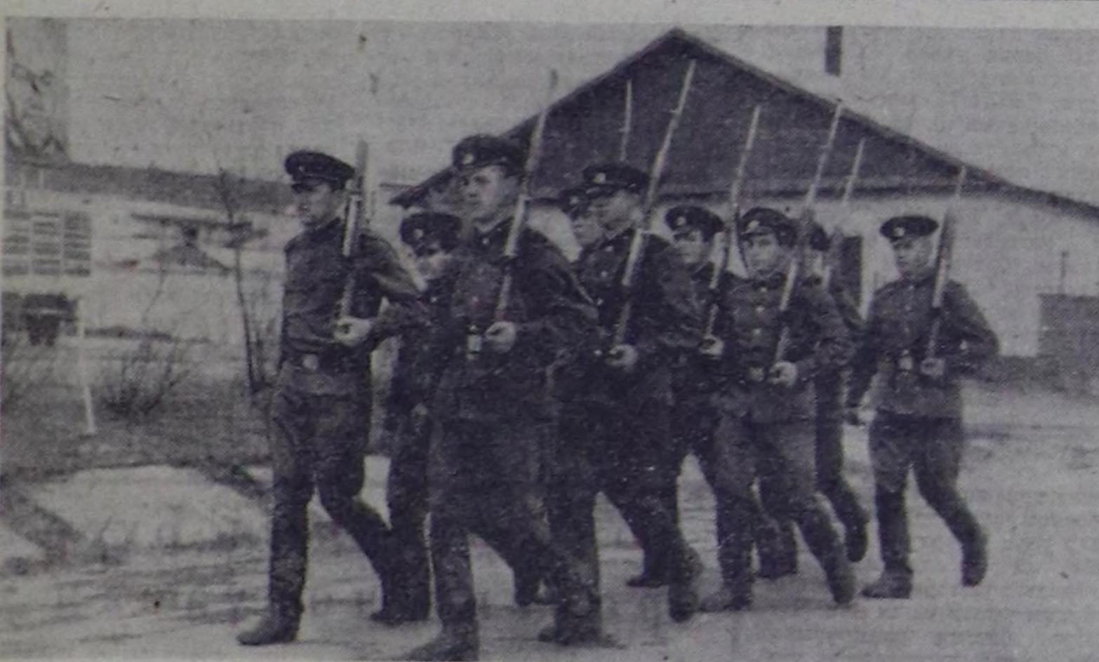
ЧУРУКТА: Совет Армияның ыдыктыг хүлээлгезин эрткирип турар дайынчылар чыскаал өөредилгезиниң уезинде.

Совет Чесектиг Күштерге Тывада барганының белекени боол келген. Соруга бола, районларда ботташ хоорайларда шериг налыныгыларын шеригге келдирип чогуур уезинде организацияг чорулар ботур. Күрүне умур-дуламык бо амыктыг келдиришин чорударыга келдиришин комиссиялар, бугурулге черлериниң ботташ