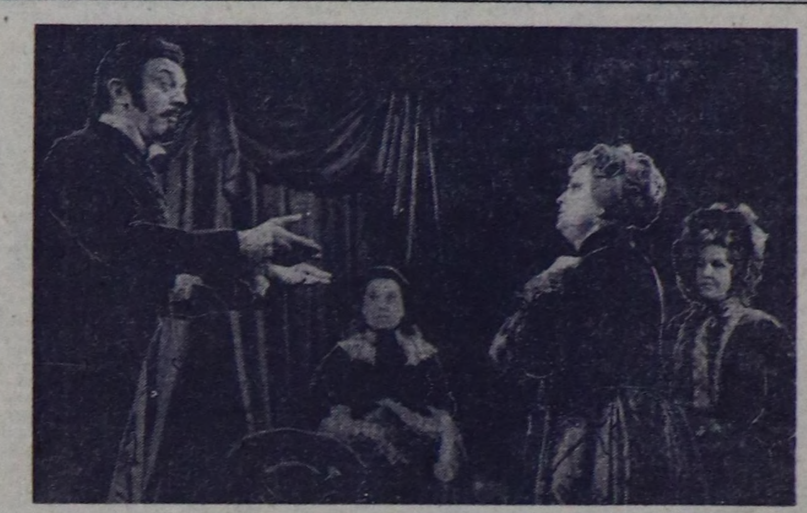
М. СТРОКОВТИН сөзү болган фотоу. (СЭТА-ның фотохроникасы).

Москваның Владимир Маяковский аттыг академиктиг театры бо чылдың октябрь 29-та 50 харлаан. Октябрь сөөлүнүн баштайгы чылдарында тургускан болганда ол Революция театры деп атты алган. Оң коллективни эге-башында тура-ла реалистик совет репертуарын тургузары дээш аралдангы келген. Оң көргүзүлгөри — колдуунда-ла амгы үеини, чок хүнерини амдыралын көргүскөн шилер, кижилерин Төрөн чурттуг эрге-ажыктары дээш эрес-шудургу чорукче мөөңөзөр сорулгалыг чогаалдар болур. Ол театрың чаңчылы бою берген.