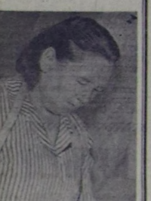
Боттарынын шилин алган амыл-ишчи, шын-ла дөстөр амыл-ишчилер Бай-Салгыч амыдырал ханым-ыла колбилдизинде эвөөт.

Олардын бирээни — Т. Пандушкына уш комбинатка он беш чыл амыл-ишчилер, дуржулгазы быжыгып, он кылган амыл-ишчилер Терентьевич амыл-ишчилер кызыл-ишчилер колбилдизинде хөй улаа эмгектен келген.