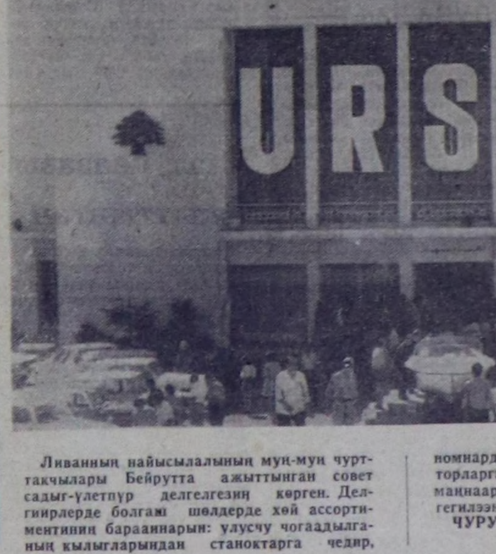
Ливанның наймысылынын муң-муң чурт-такчалары Бейрутта ачылгаштын совет саям-улетпур делегезин көргөн. Дегирлерде болагаш шөлдөрдө хөй ассортиментиниң бараанынын: улдучу чогаалдыгынын кымгарындан станоктарга чедир, номнардан автомобильдерге болгаш тракторларга чедир, савалардан хемге дүргөн маннаар катерлерге чедир чүдүлериң делегезилеэн.

ВАШИНГТОН. (СЭТА). Африкадан эрге-буруну кижиги сөөгү тывылган. Оон чуртта чоразан үезинден бээр 2,5 миллион чыл өрткөн деп турар.