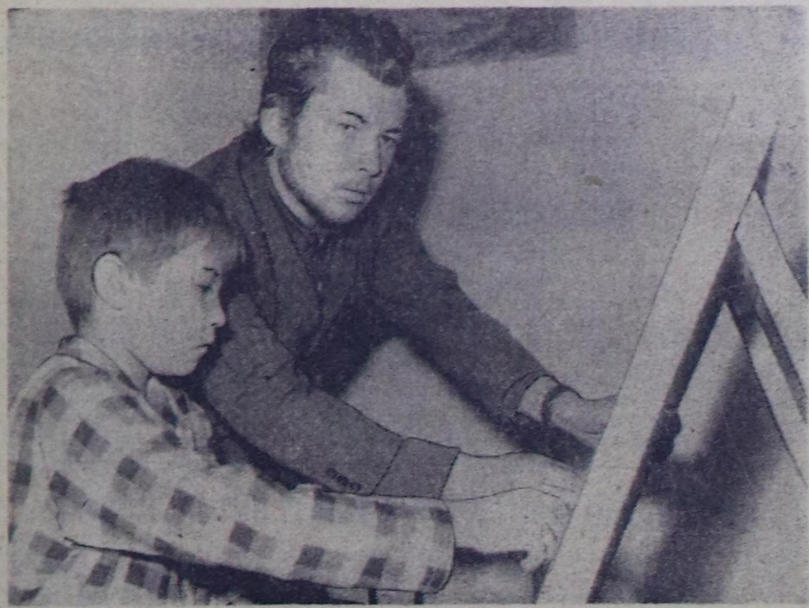
Ак-Довуракта чаа Култура ордуу бо чылдың июльду эгезиде ачылганга киргени билер болгай бис. Оң аргаш-ле ол хоорайык чурттагыларының ажил сөөлүнде чыгып дилтанар тери апарган. Бо хүнерде Култура ордуунда культу-ре-массалык ажилдары оон удуртукту-лары эки организовал, мында янзы-бүрү бөлүмнөри түзүлгөн.