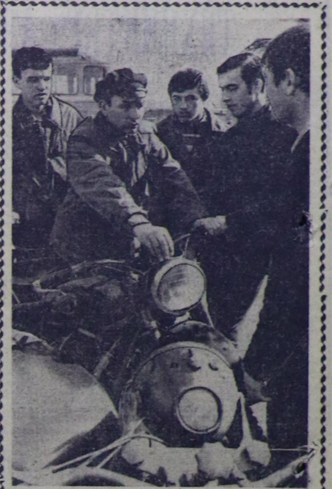
ИСКОВО ОБЛАСТЬ. Великолукск локомотив-вагон септасге заводунун чанында өөрөдиге пункттуу-областа эң эки ажылдык чер. Ол өөрөдиге пункттуула шериге баарларын белеткөөр эки өөрөдиге баалам, техниктиг, шити-шериг белеткелерини тускай кластары болгон өскө-даа чүүдөр бар. Чоокта чаа халакат турин ажыткан. Совет Армияга барып албан эртирер анык ажылчынар ишда өренип тур-рар. Заводта ажылап турар дуржугалыг инструкторлар-нын, кураалында офицерлерини удуруттамыс-бисе шериге баарлар тактиктег, боолаанын болгон техниктег белеткөө талаамы-биле бажы билгелерини шийгээдин ап турар.