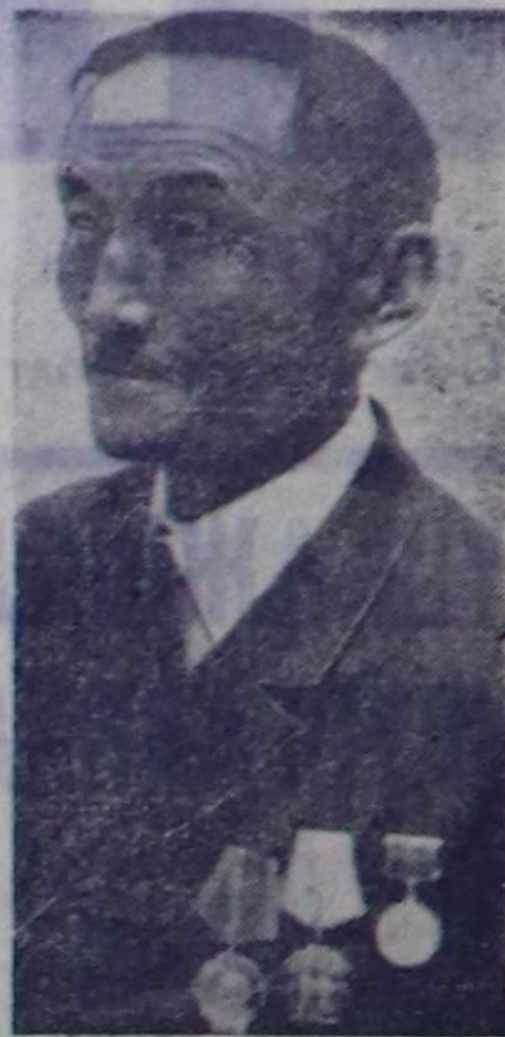
Барын-Хемчиктин ажыл-ишчилери чугаалап тур. Тудугжунун УЛУУ.

СЭП-нин Ленинчи национал политиказын, пролетар-жы интернационализмни тилгезини, бистин туртувустун улустарын чыгыс энин, найралык болгаш аял-дунмалшык чорунун байырлаа — СЭП Эвилелин тургустунганын 50 чыл юбилейине бистин Төрөө чуртувус хун келген тудун чооктулга ора. Бо тургуту байралага күш-ажылын чедикширер ужуражы дээш совет Тыванын ажылчы чону белектерин турар.