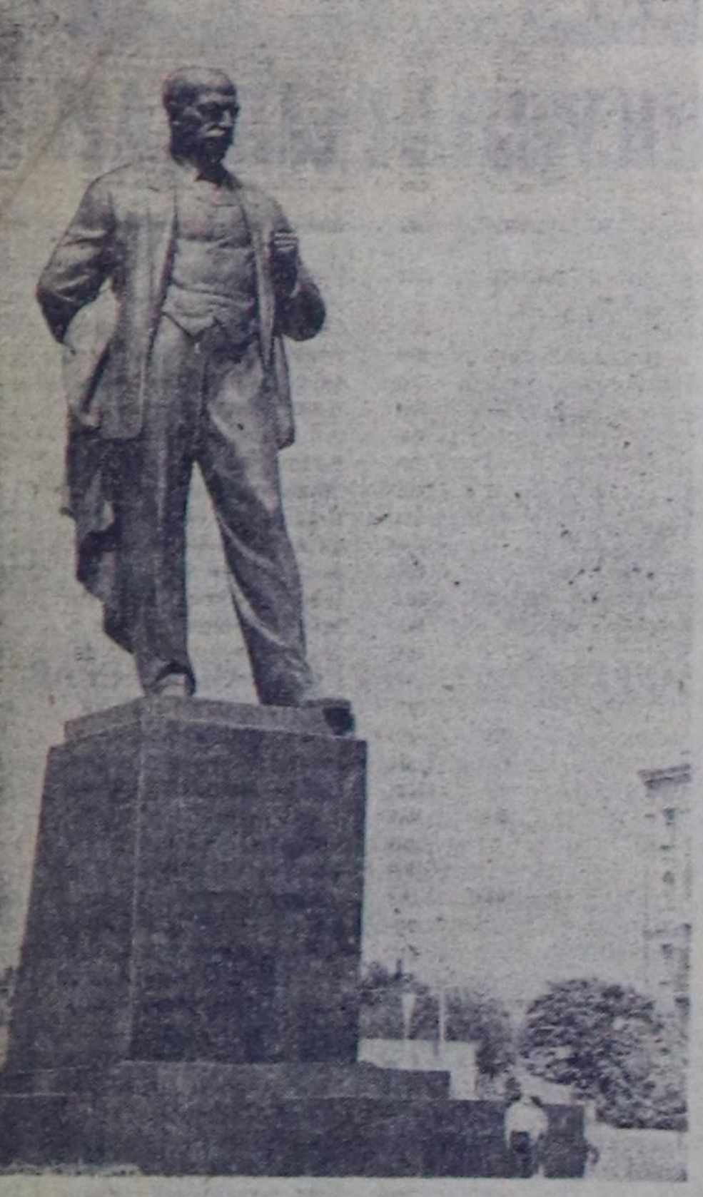
Бакунун Мурнуу-Совет шөлде партия болгаш күрүнгө кайгамчыктыг ажылдакчысы, ССР-нин Топ Күүсекчи Комитетинин Даргаларынын бирээси чораш Нарман Нармановтун тураскаллы ажиткан. ЧУРУКТА: Н. Нармановтун Бакуда тураскалы.

Бистер совет кижилер кайгамчык чагай үде чурттап, ажылдап турар бис. Комунисттик партия болгаш Совет чыгачылык чондарынын чагай бөлүмдүүнүн дугайында доктаалар сагыш салып турар. Кижинин ажылдарына, дымтанарына болгаш оон бүгү талаамы болбаарына, арга-мергежилдин бедидеринге үе-мак база четтир. Биччалажак оңу инчаар ажылдарына эргинин артымын кыялымы, малагы арагачылардын шаптыктап турар. Чогуу-ла ычанган бистин партияны арагачыларга удуз шийтирилди демиселди чорудармыче бүгү хой-ниитинин кичээлгеин укладымын турар.