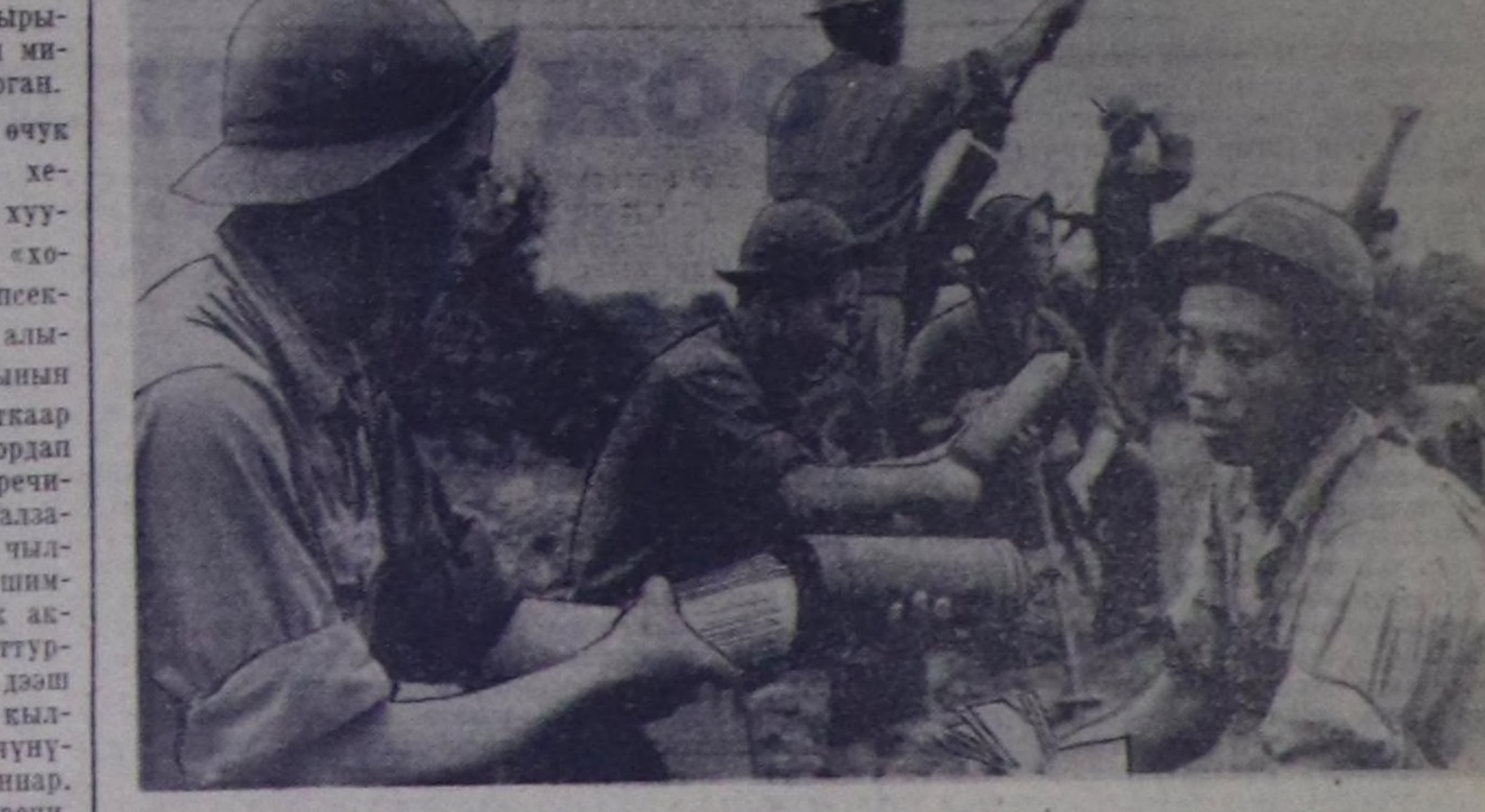
МУРНУУ ВЬЕТНАМ. Хосталганың улусчу чепсектиг күштеринин дайыңчылары америк-сайгончу шериглерин турар херечилерге хуудустарын өнтөп, дайыңчың сол- даттарынын ортузунга пропагандалы урчулап кылып турар. ЧУРУНТА: Хосталганың улусчу чепсектиг күштеринин минометчилерин сургаал- далыг хуудустарын тусай хола иштине сукаш, сайгончу шериглерин турар че- ринче адарына белектөп турар. ВИА — СЭТА-ның фотозу.

Сөөлү хуннерде судка өчүк берген «буруудадышкыны хе- речилери» Анджела Дэвист хуу- да эрге-ажыны хараан, «хо- ругдаттырганары боо-чепсек- тиң дузаны-биле хостап алы- рынын орадалжышкынын кылган» дээрин бадыткаар ужурут деп прокурор кордап турар. Амгы үеде беш херечи- лерин өчүүн алган, иччала- да олар шуутуу 1970 чыл- дын августун 7-де негр шим- чээшкенин бир бөдүк акти- вчилери боттарынын тутту- ган иштерин хостап алыр дээр дидим орадалжышкынын кыл- ганнар дээринден өске чүгө- даа чүгөлаал шыдаваннар. Ыңчаарга чангыс-даа херечи, оларнын-биле кады полиция капитаны Г. Тиг болгаш фото- репортер Дж. Кин-да, «авгус- тун 7-де болушкунга» Анджела Дэвистин «киришкенин» хөрсө-даа бадыткашкынын кылдып шыдаваннар.