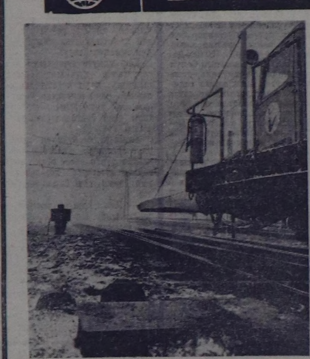
Будапештин демир-оруктарында стрелканың харын аштарыга тусай тургузуламын ажылдан турар. Ук тур- гузуламын ажалдан үндүрер иан газы релестерге ажал- ды харын эргээр. Ыңчаарга бир шакта машина мындыг арга-биле 25—28 стрелканың харын аштар.