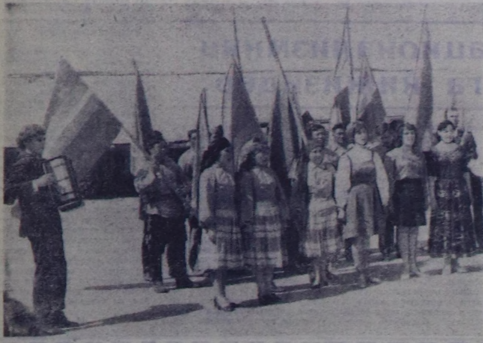
Совет Эвилелинц хэй националдыг акыдума улуустарының бот-боттарының аразында эионивика болгаш культура талазы-биле харылзаазы хун келген туудум-из бынгыгып турар.