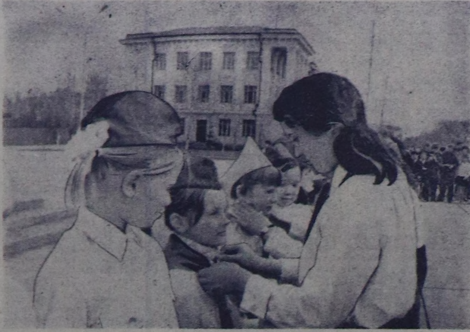
ЧУРУКТА: пионерге хулаят алышкычын.

Наймызал Кызылдын Ленин кудумчузу. Оор бир талаа-биле ыргак, хөгүг уруглар чыскаал-биле келген. В. И. Ленин аттыг шыге доктап берди. Ур-даа бо-баанда мындыг өстөрөнг дагырак агаарга чагыланып дашпады: «Ауу Ленинни чаалам деп. Коммунист партиянын өрөдөл турары ышкып, өрөдөлүмү дагыраган тур мен».