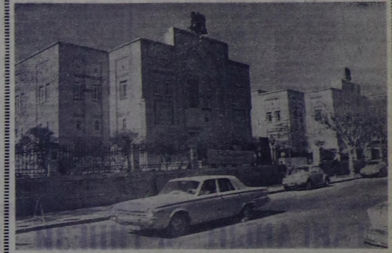
Апрель 17-де сирия улус чурттуг деис-көргөндө даштык шеригерин үндүргө-ниң 26 чыл оюн демделгээр. 1918 чы-дан бөр чуртка туруп келген анга болган француз шериглер сирия улустуң ка-дыг-дошун демиселиң болган бугу де-сеткил демократтык хой-интиниң де-сеткил хуруге түрүндө 1946 чылда Си-риядан үтүн чорур укурга аргажоктал таварышкан.

Ол үеден бөр чурт хамаарышпас хөг-жүдөң болган чурттуг экономика-ны даштык монополияларны тергилдөө-ниңден хостарының өрүткө кирер арганы алган.