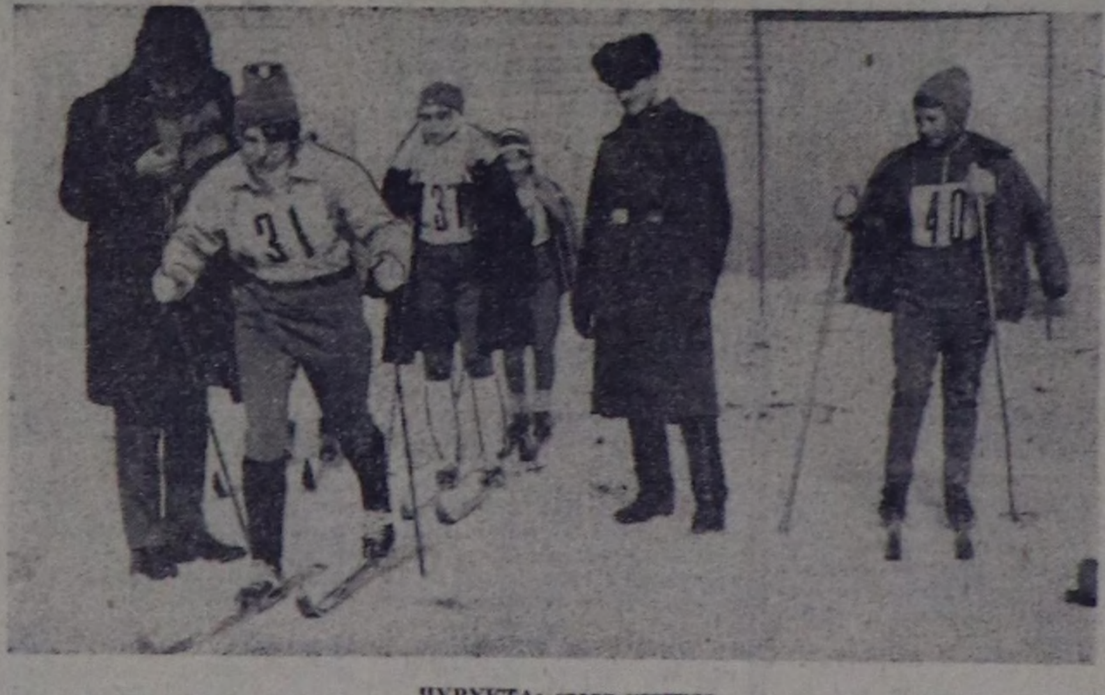
ЧУРУКТА: старг үсүндө.