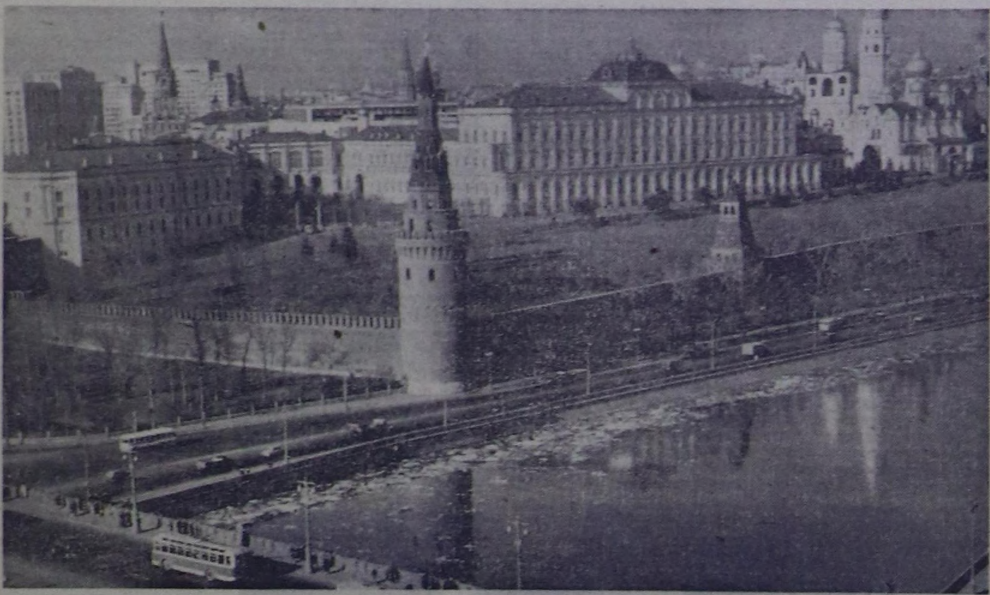
МОСКВА. КРЕМЛЬ.

Бистиң Төрээн чуртувустуң, найысылалы Москва дугайында чугаа