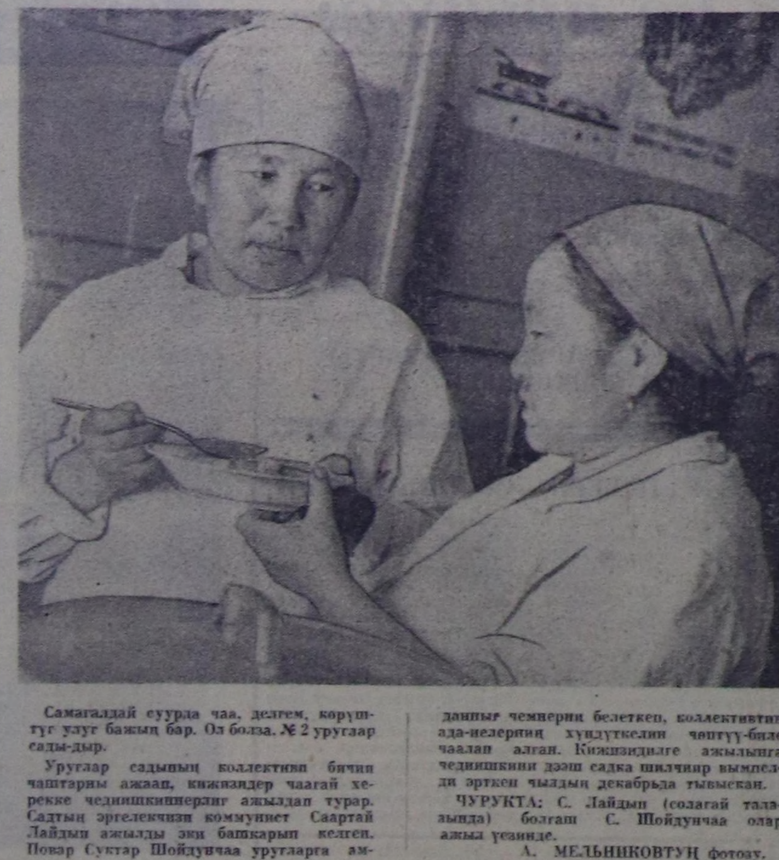
Самгаалай суура чаа, дегем, көрүштүг уагт бажык бар. Оз болза, № 2 уругар салды-дыр.

Чамдык чедирчиликер-биле хообаштыр эркен чыдып көрүдөнгө танды культу-рамын оң мурунда турган-дан куду девелдиг көрүс-көн районвар база бар. Олар-га Биз-Хем, Каа-Хем, Овур районнарын коллективтери хамаарып. Бичаган олар-нын репертуарында ленин-ди куду, чиг, укур-тунаан эки тодартымынан номерлар кир-берилген.