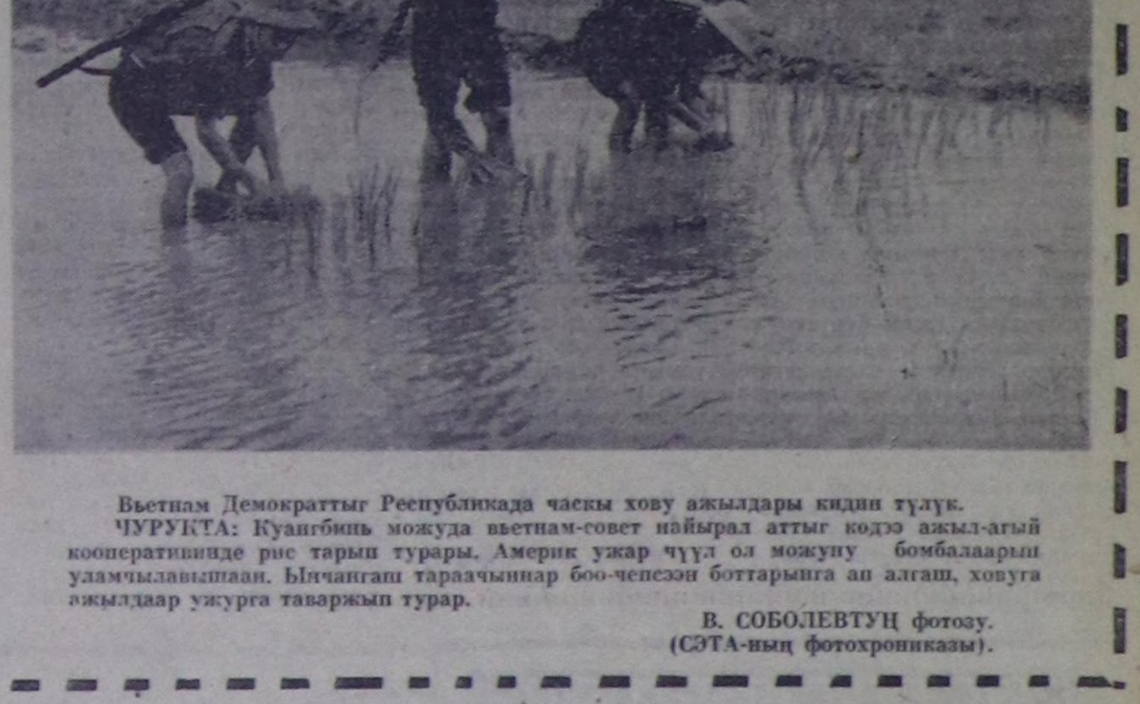
Вьетнам Демократтык Республикада чакы хову ажалдары кидин түлүк. ЧУРУКТА: Куангың можула вьетнам-совет найырал аттыг көдө ажал-агый кооперативинде рис тарып турары. Америк укар чүл ол можулу улумчыламышкан. Ылчынга тарачынар боо-чепсез боттарына ал алгаш, ховуга ажалдар укурга таварык турар.