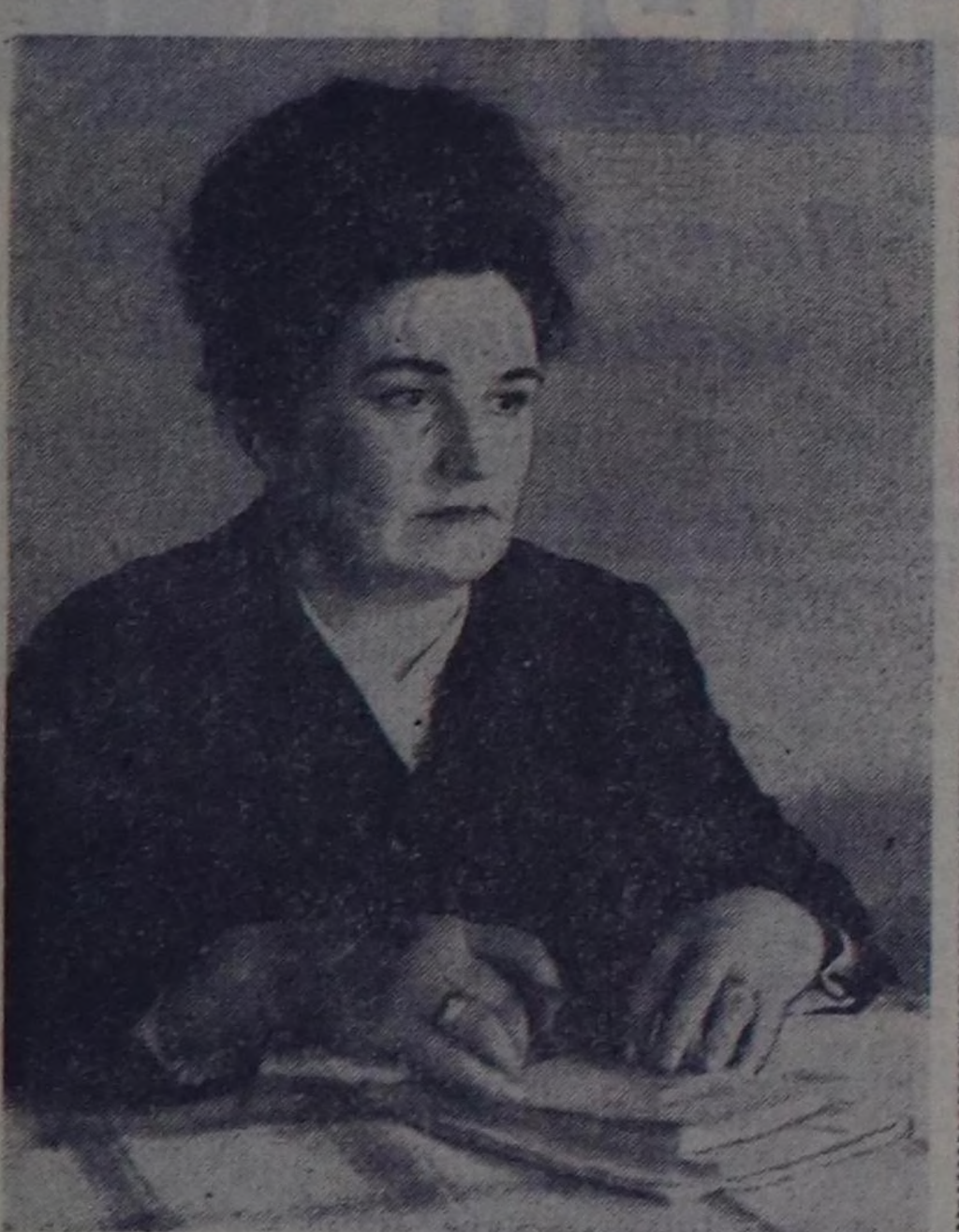
Дарасымда киви кирпи — деп, бир-ле херезине кийинчи үнү дыңдалды...