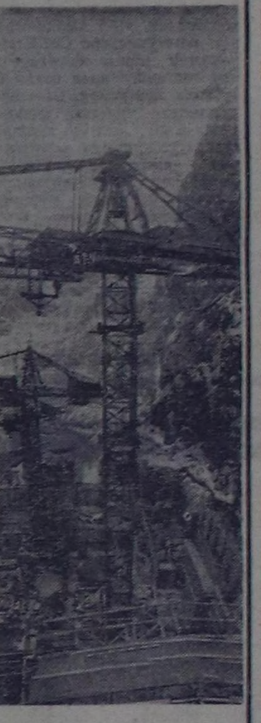
КЫРГЫЗ ССР. Тянь-Шаньда чер шимчээшени болтулар алаанына хамаарып черде канчаар-да аажок улук энергетика бедирини делейт практикада эң баштай туруп турар...