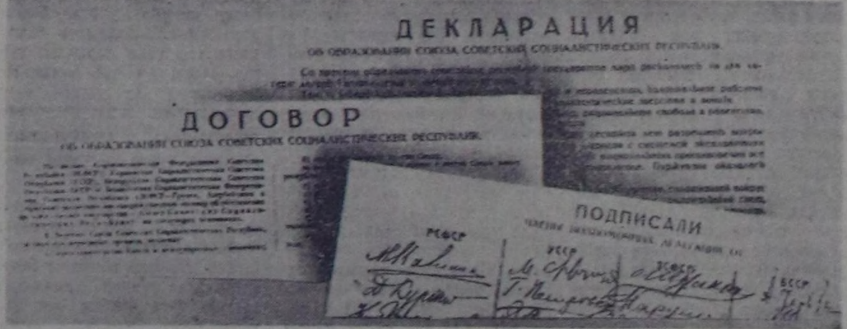
ЧУРУКТА: Совет Социалисттик Республикалар-нын Эвилелдин тургузар дугайында Декларация болган Дугуржулга. Дөрт совет республикаларын бүрүн эргелиг төлөөлекчилери анаа 1922 чылдын декабрь 30-де ат салганнар.

соксатпаан 1922 чылдын декабрыдан 1923 чылдын мартына чедир Владимир Ильич бодунун сөөлгү чүүлдерин болган чагааларын адап берип турган. Делегалариниң бир көргүзүүдө баштыкчынын национал айтырымына хамаарышкан бижиниң делген салган. Ону Владимир Ильич Ленин 1922 чылдын декабрь 30—31-де адап берген.