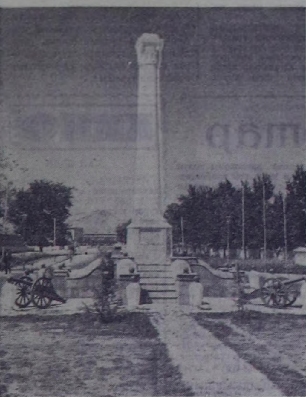
ЧУРУНТА: Хамаарышпас чорутун Кабулда тураскаалы.