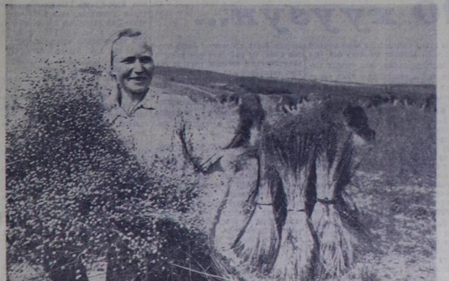
Смоленск областың Смоленск райоңунун «Красный доброволец» колхозу улуг байырлаал чылында 850000 рубль орулга амыр деп дөвөөлөп