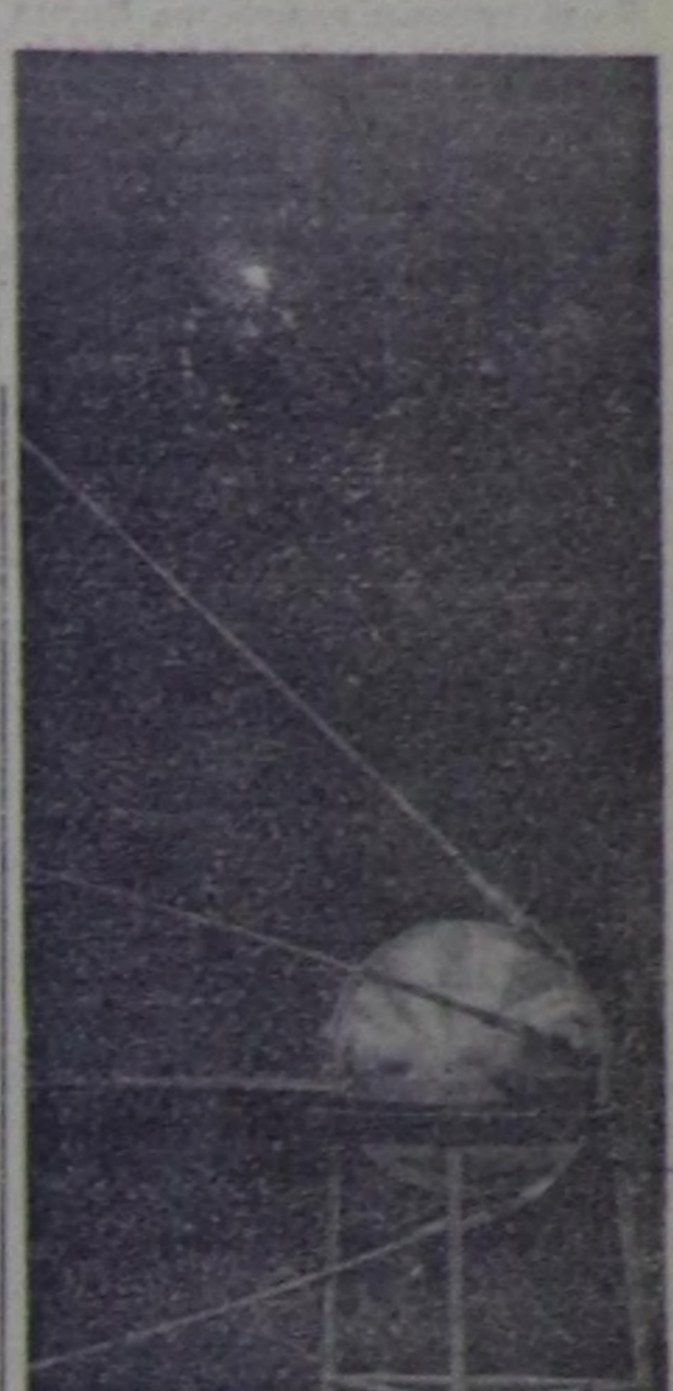
Чурунга: Черниң баштайгы совет кылмал спутниги.