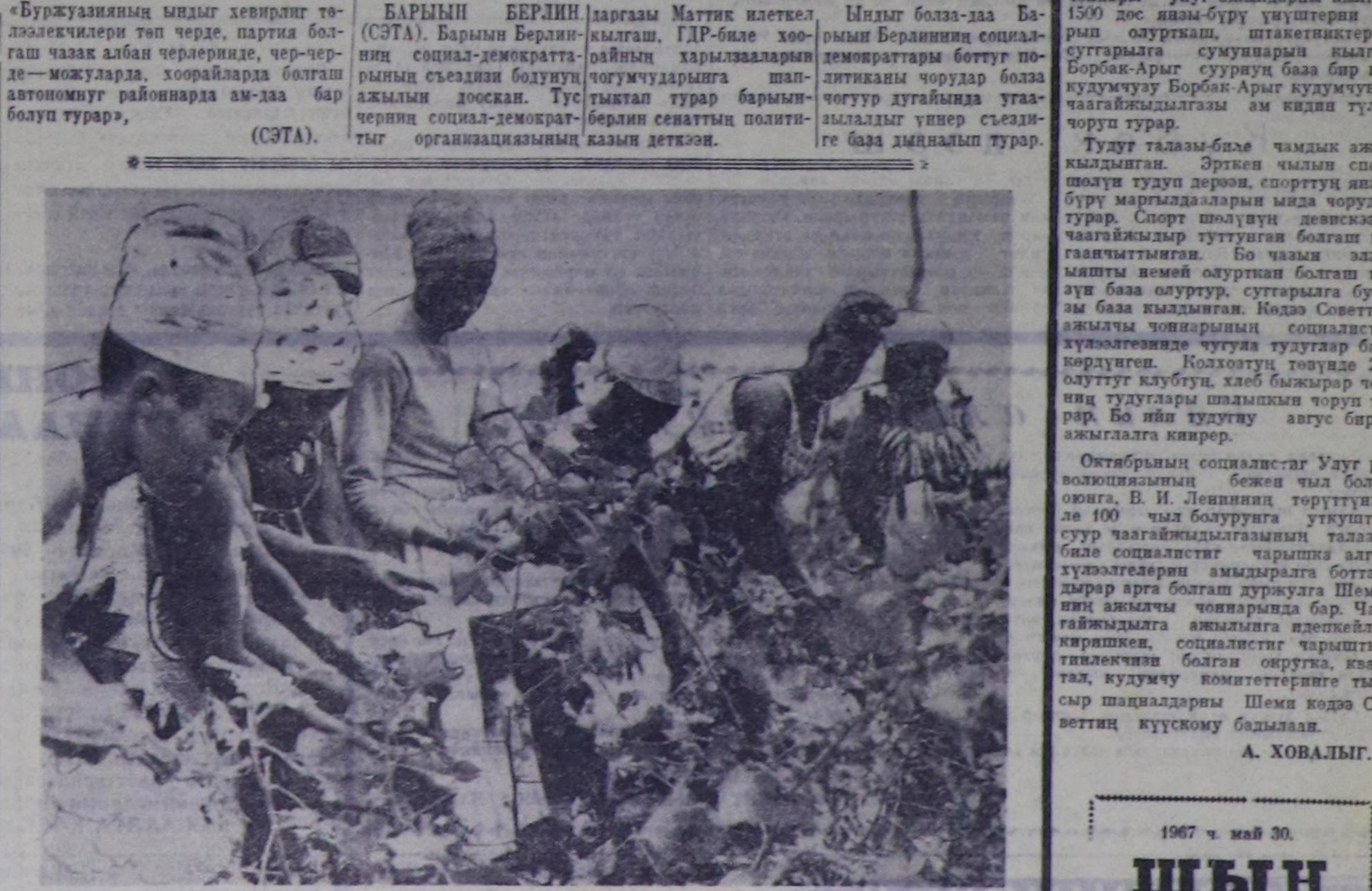
ЧУРУНТА: коллективтиң шөлө хөвө ажаап алышынын. АНИМ—СЭТА-ның фотозу.