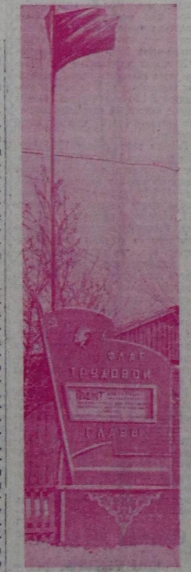
Көдөз ажыл-агыйнын мурунчаларына тураскадыр районун күш-ажыл алаарынын тугу.

Тыва АССР-нин Дээди Сөвединин Төлээлекчилер сөвединин хуралы 1967 чылдын март 30-де эртенгиин 9 шак 30 минута турда хөгжүм-шин театрынга болур. Тыва АССР-нин Дээди Сөвединин сессиязы 1967 чылдын март 30-де эртенгиин 10 шакта хөгжүм-шин театрынга ажытынар.