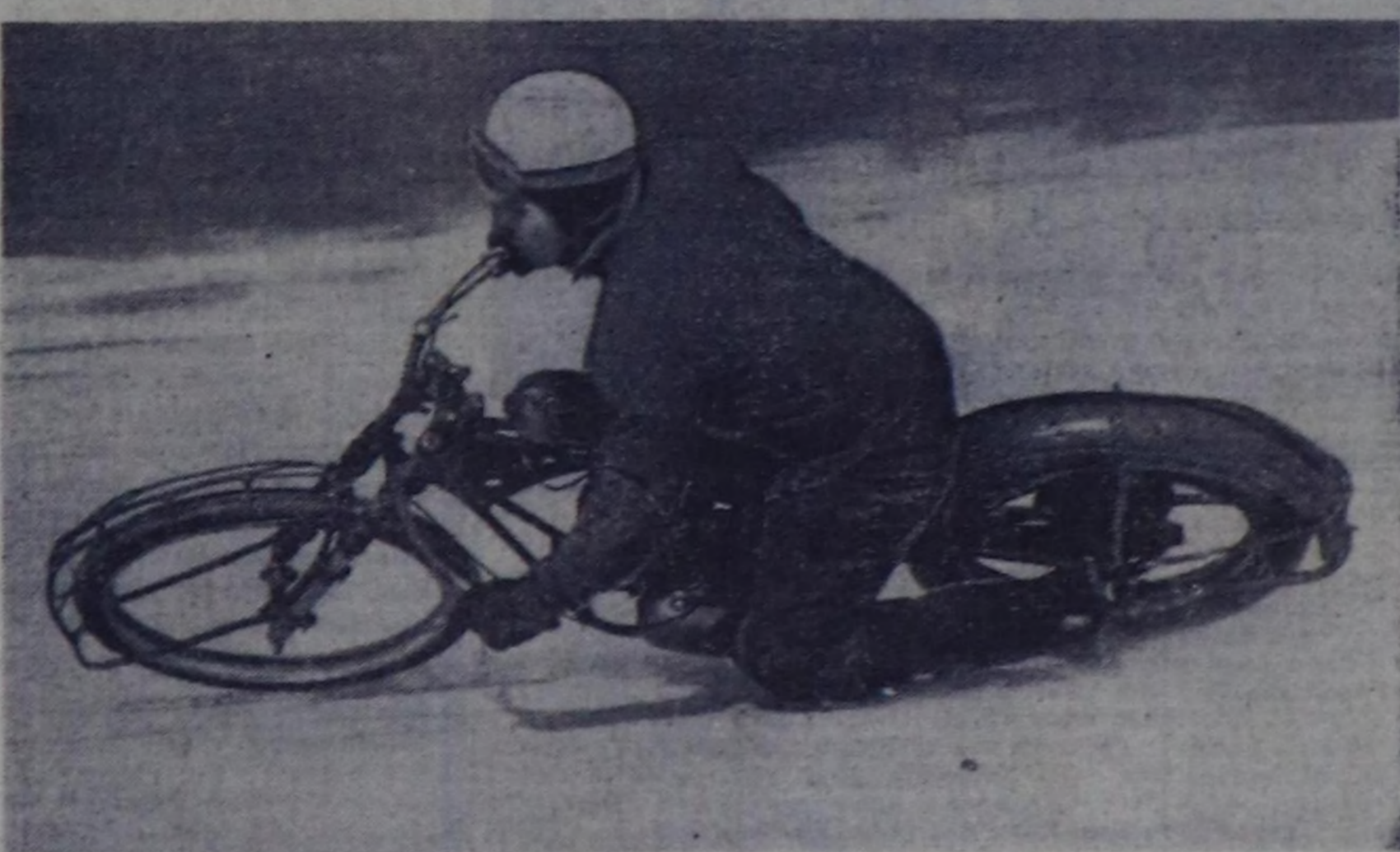
Икылдын, Абаканын, Минусиникин, Сарыг-Септиң мотоциклдери республика нарыгына култураның болгаш дышталыгының Гастелло аттыг паркында сеп суууң дожунга ам келир өскөсүндө чыгып тирилер. Аңа белетменип турар.

ВАШИНГТОН. (СЭТА). Янм-бүрү чурттарын чорудуп турары тайыңга чүткүлдү хемчеглер турожок, Согуу Вьетнамны бомбалаар чорутуу каалч-даа кошпады артымы бербес мен деп, АКШ-тын президенти Джонсон меделгеш. Теннеси штаттың хоюлу үндүрү хуралынын кежигүнериниң мурунга Нависил хоорайга чүве чугаалап турган. ВПР-ни америк уадр чүткүлдү бомбалап турарын агартыр дээр бодунгу мурундагы «чылактары» ол дакырап турган. ВАШИНГТОН. (СЭТА). Америк демократы 100 ажыг чыл мурунда ажылап кылдыган принциптери бо хунге чедир боттанмаан деп, президент Джонсон Нависил хоорайга кылган чугаазыга меделгеш. Куруне эргеленип чорууду каалгаш америк кижини каржылдаш чок кылып турар ылгай чедир орадалжып келген бис; америк курунениң үндөшүлгөлериниң ол күрүне тылтып келириниң ырак мурунда-ла бодал тышканы дыка хей чүддөр бо хунге чедир боттанмаан, ычангаш ону кажан-даа бүрүң күүседип шыдаас бөөр бис деп, Л. Джонсон меделгеш.