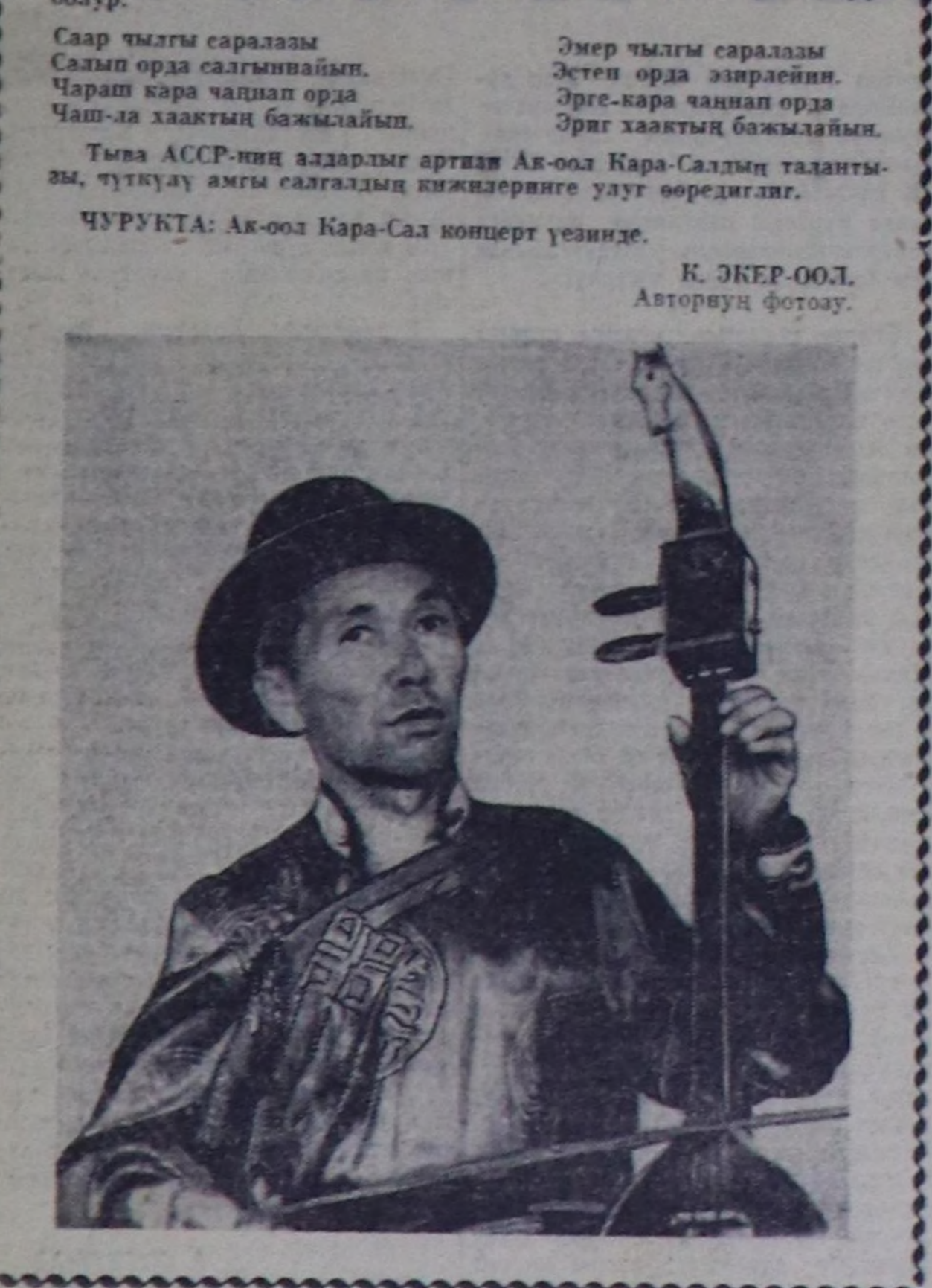
К. ЭКЕР-ООЛ. Авторуну фотоу.