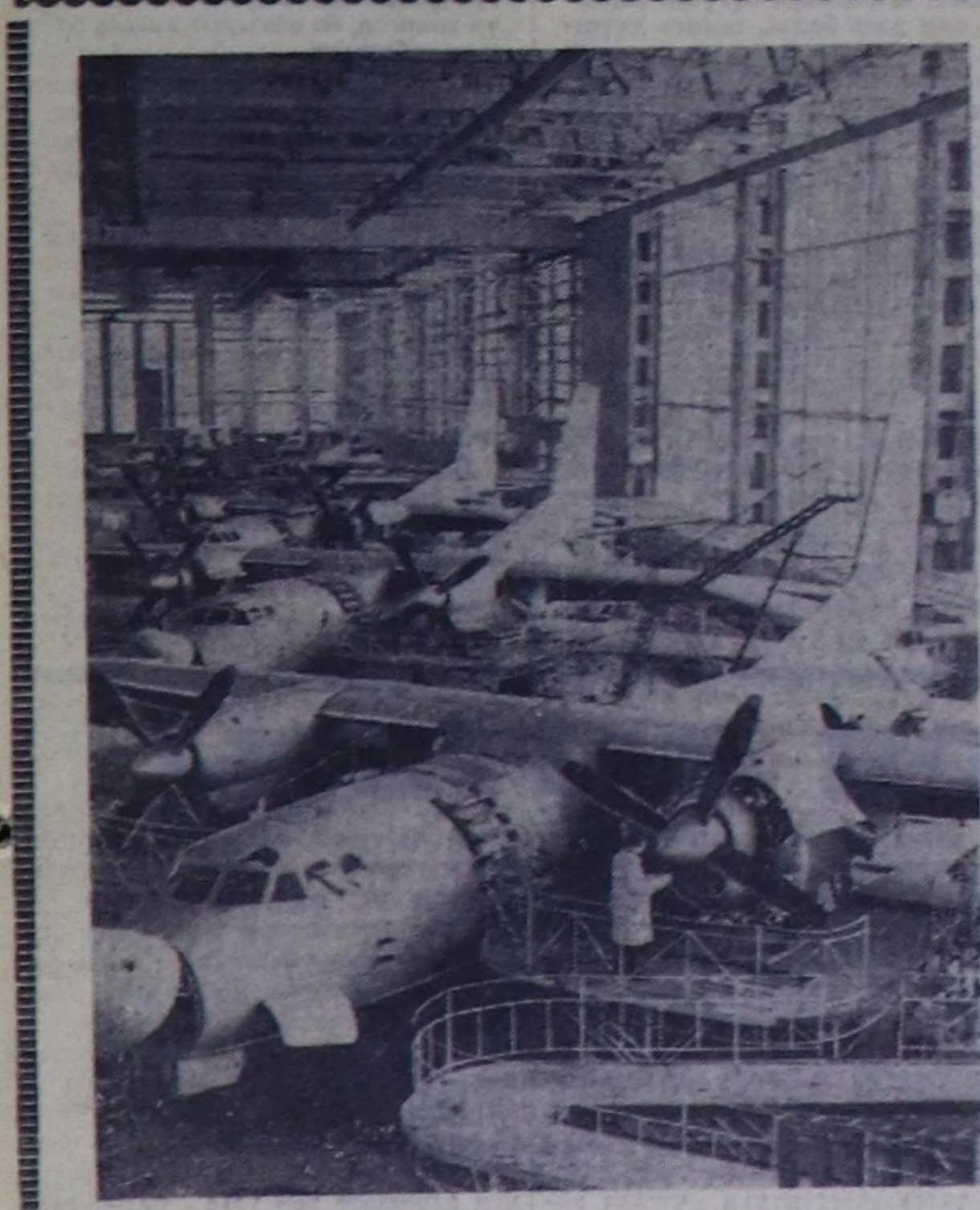
Киевтин ухар-чүлү заводунуң коллективни Улуг Октябрга алдар кылдыр күш-ажылчы бедик көргүзүлгүг ажылдап турар. Чуртка: заводтун эгелдег пегинде. «АН-2» дээр самолөттү эштер тур.

Артак культураларың сөвдү гектарларын бешин шынарлы тарып дооскаш, таргалыңарнык чайгы ажаалдазын организациалык чорудары — механизаторларнык, тарзыларнык дайынчы, дары-болгалык хуулазген өл.