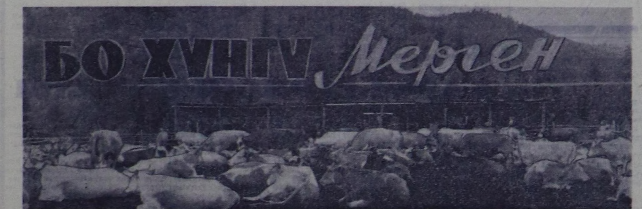
Партия ажилдакчымы болгаш чо-гоалык С. Токаным «Араттың сөзү» деп сураскаан тоожуу кончүкчү-нү тангыштыр эгелээр Мерген хем-би-ла болгаш. «Шаа шаа-биле турбас, чамыдак көзү-биле турбас» дэши мыккан, шаадыг Мерген тамыттын-мас кылдыр өскөрдөп калсаң: тос ча-дыр турган чериң чоңунда электри-житкен болгаш радиожууктам, үлөс-лөжүгү калсаңарың, малчылар чырык, чымы бажыңарың, ясаи, клубтуң-бедик бүдүрүкчүдүгү мал фермазы тургустунган.