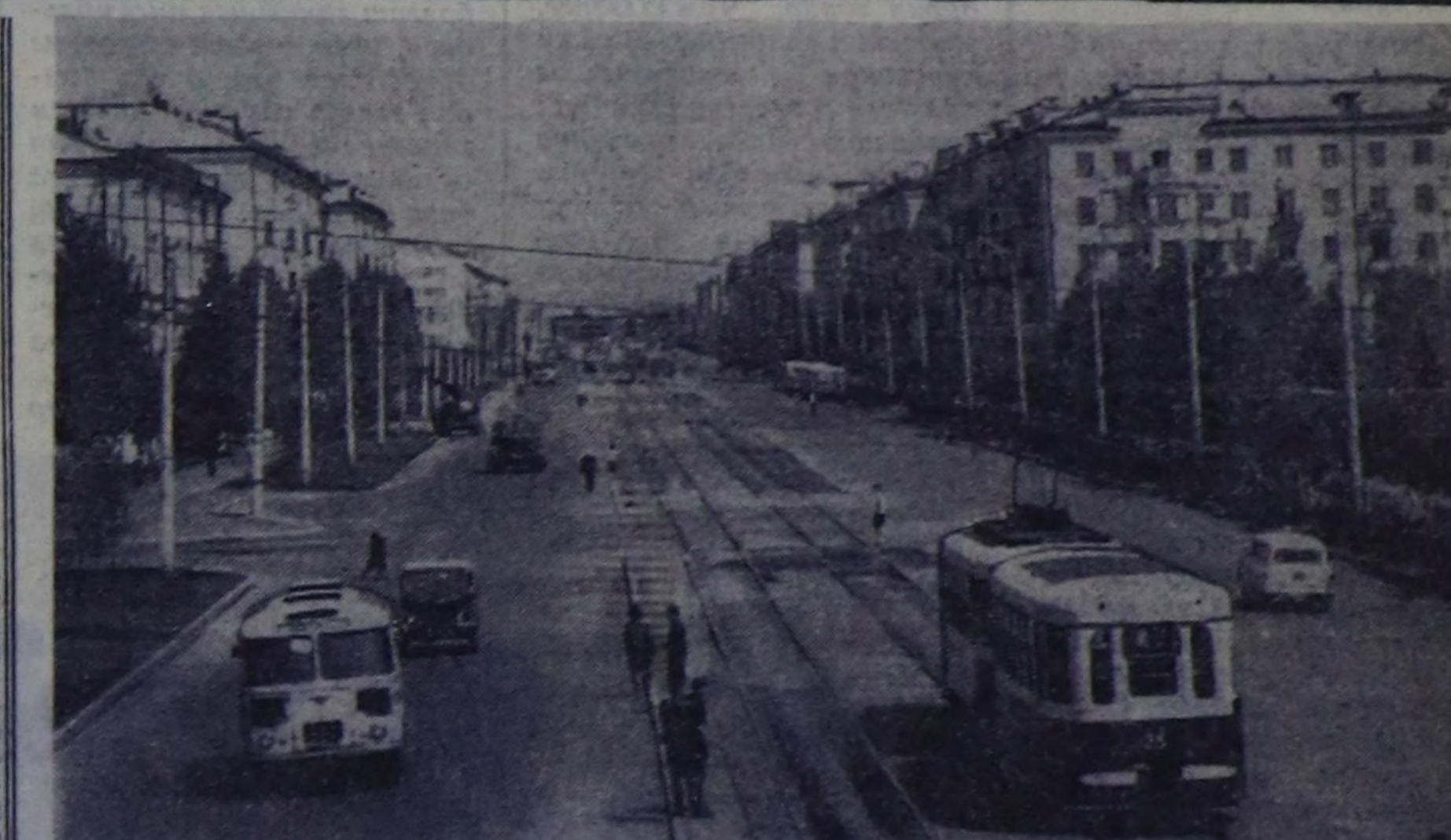
Ужун беш чылдын мурунда Комсомольск хооранын түдүп эгелээ. Бу дүңгү Амурда-Комсомольск — алды уениң иби чус муң чурттакчылыгы болу хоорай-дыр. Дуун ол хоорай 35 харлаан.