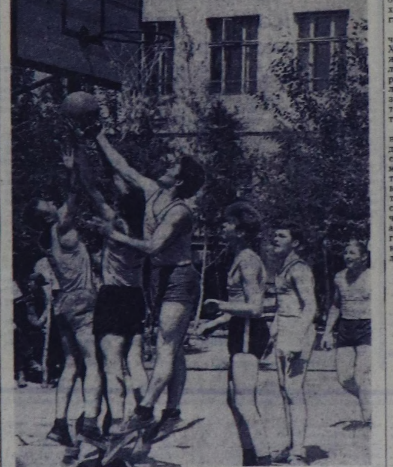
Чурунта: Кызылдың көдө ажыл-агый техникумунун сургуулары биле Тес-Хем районун командаларынын ойнап турары.

Чамдык элестетип бо айтыргаларын салып турары чөре шык. Чымыл командалары республиканын спорт чөвүлели чымы, зона айымын маргылааларына белеткендирин турар болгаш ол-ла маргылааларга киржери-биле чорудуп турар. «Спар-так» болгаш «Урожай» эки-тура спорт ниятелидери база-ла хире-черге-биле чымыды командалары киржери-биле чорудуп турар. Зона маргылаалары бистин спортчуларымын белет-кенде бар чөтпес чүгө олары чүг-тө маргылаа болурунун мырынай