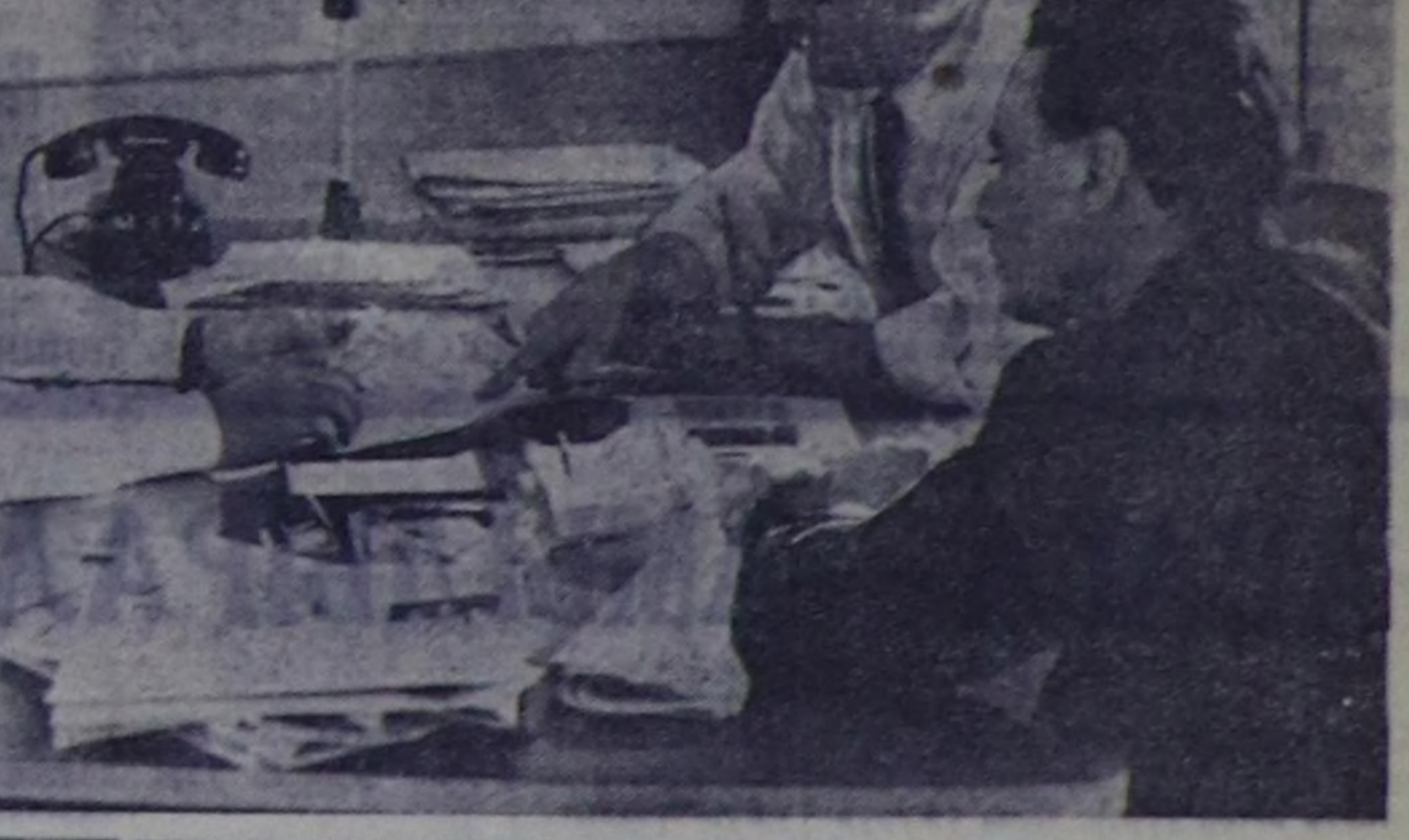
Италиянын Коммунисттик партия-нын органы «Унигата» созуунуң бирти номери 1924 чылда Миланага үлөгөн.

Ол үелде эгелөөш дөртөн ажим чылда «Унигата» созуу Италияда болгаш даштыкмы болушкунунын дугайында шыгыныг информацияны массалаарга чедир, ажилчы чыгарыш организастап база утап чыгарыш, дарыкчыларга удуу бот-тарынын эргелери азын оларын чөптүг демиселинде дуалап турар.