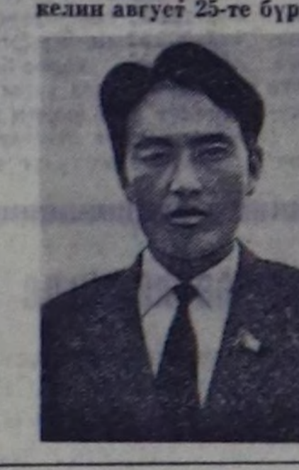
Совет эрге-чарыгарын 50 чыл онуга уткуштур

барык-ла октябрь ортаныга чедир садыдын келгеш, он-на ажал дүвүр агазылар. Бистин бригаданын мндык бай-далды шугуучулэчи бу-биле бургу шаап турарын бистин хойжуларымын чаалаган көрөгөнн мурунда-ла камгалгаларың септелген дооскан, көрөгөнн контар-тып, өдөн болуп каан. Ам бистин мурунуга кызымак мал чегинге 135 тонна сиген бектеэр соруга салдынын турар. Бу чылым сигенниң үнүжү эки, панын ажыр кууесин болурунч ар-газы бар. Бригада хой кыргыз-даан организациалары эрттеринге белектенин алган, чугула колхозтун дирекция черинин башта-дан графтин маан турар бис. Бу чылым 2352 хойдан 5 тонна 171 кг дукту кыргыз, кургунге дужаа бис. Совет эрге-чарыгарын 50 чыл онуга уткуштур културга-амыдырал хандырылга-мын талазы-биле чаа чугу кылып аларын бригаданын келгиуни-