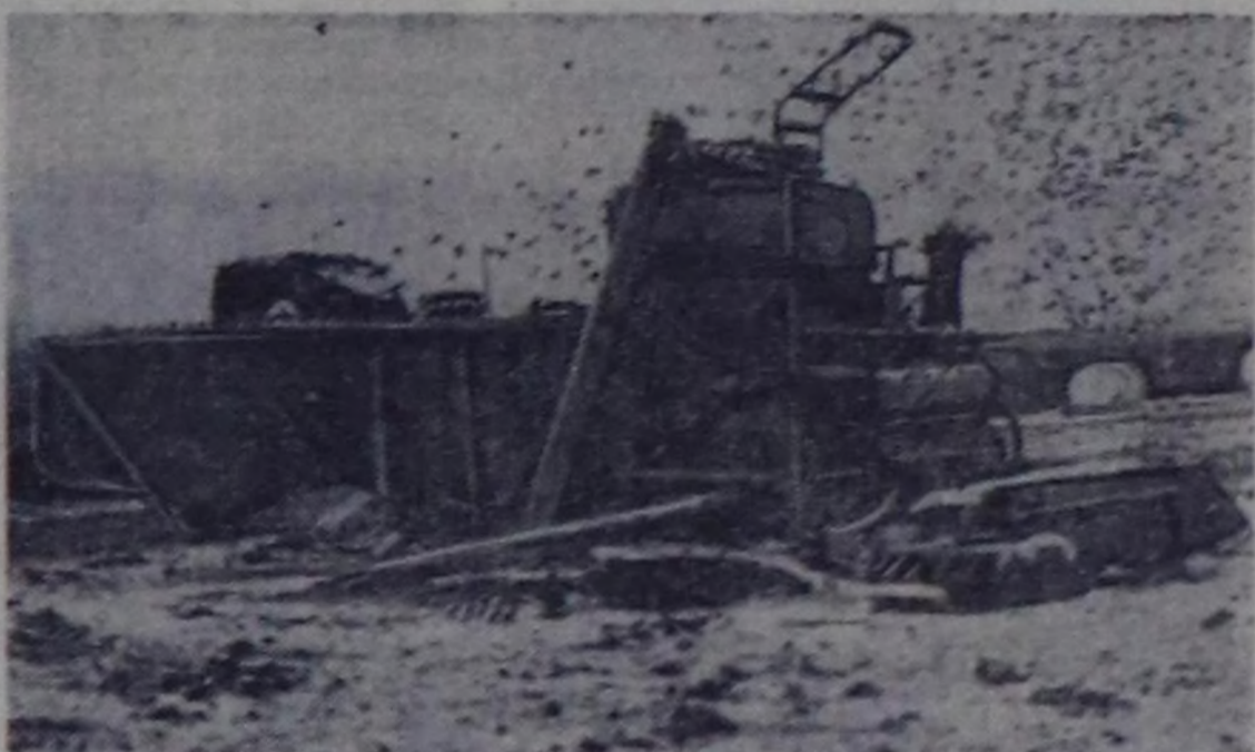
Фото буруудадып тур