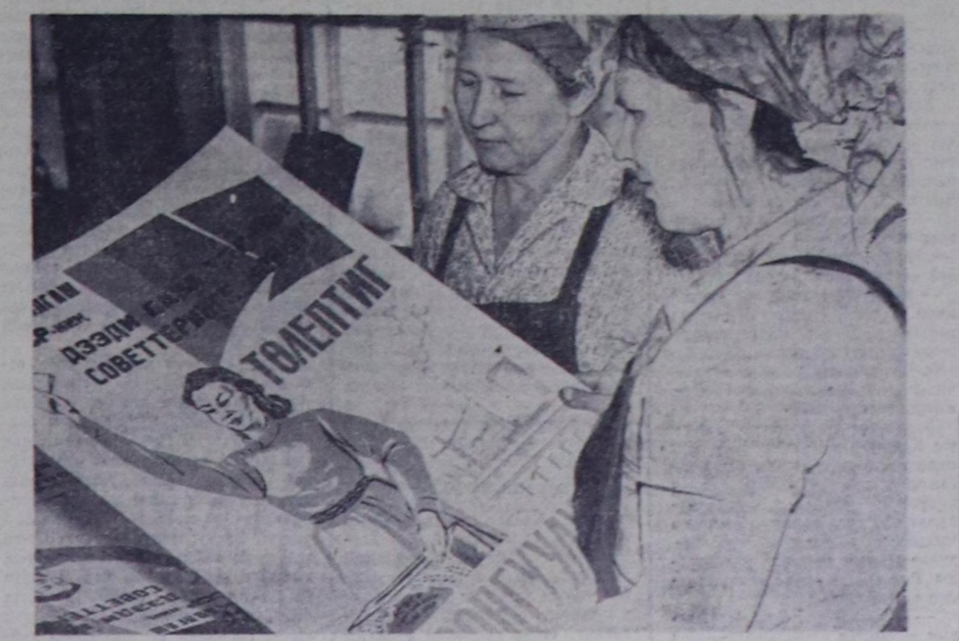
Политиктиг чутула кампания — соңгулдага ал-даржыктык куш-ажылчы элчеге типографиянын коллективни киржиң турар. Амгы үдөш полтаграфистер соңгулдага хамаарышкан харымсалгалык амжалды кы-лап турар.