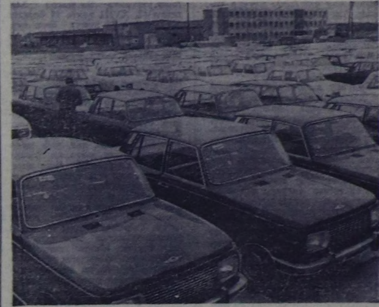
Герман Демократтыг Республика. ГДР-нің автомобиль заводуң бүтүрүп үндүрүп турар чине машиналары чурттуң иштиңге болгаш даштыкка да удуу-биле сургазган.

Непир чылдың февралда Будапештиге коммунист партияларның консультативтиг учуражышкыныга байр чедир-бишкан, «Пуэбло» солун акы-дунма партияларның чаа чөвүлел хуралын чыдылар дугайыңда шиптир-ни ааза хүлээп алырыңа идеяң.