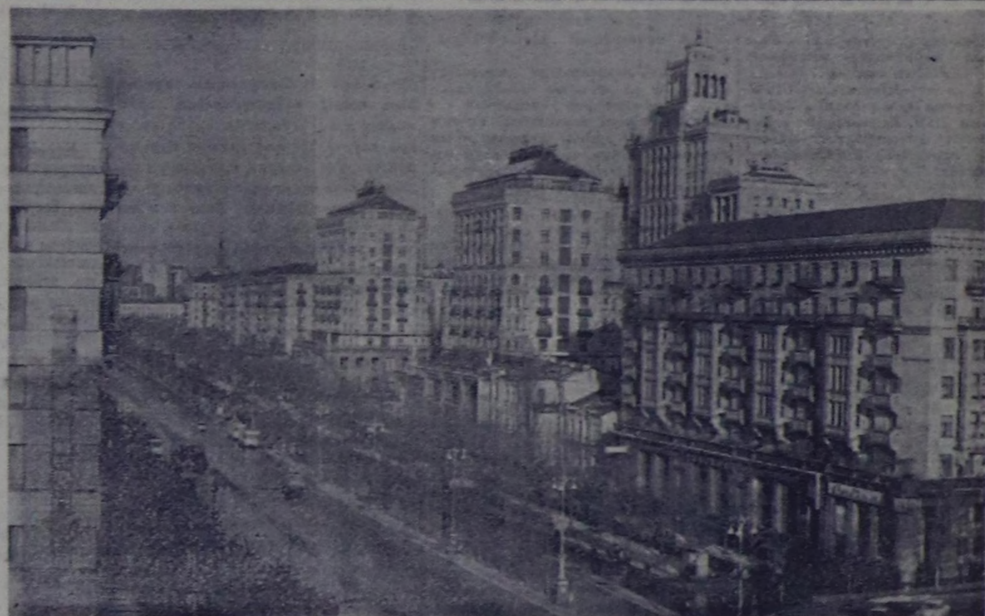
Киевтин төп кудумчузу — Крешатик.

Физикалык, кибернетиканың, үнүштер селекциязынын талазына украин эртемденериниң ажилдары чүгле бистинг чур-