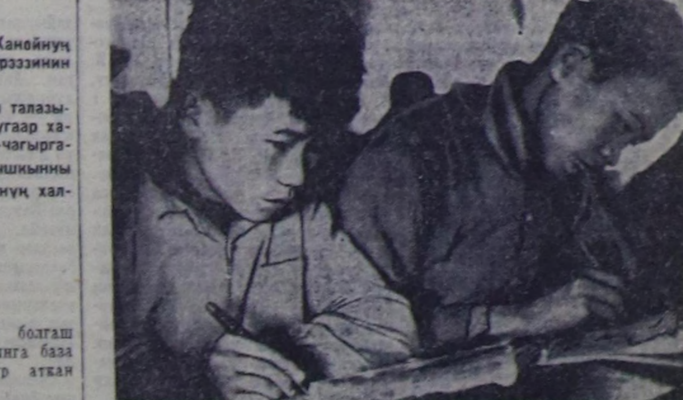
ХАНОЙ. Мында даын байданыга үшкү, чаа өөремдеги чылы эгезин. Чурунта: школа кичээлдеринде.

Вьетнам бифе америк агентиледик дынаатканы-биле алдырга. ВПР-нин агаарында дүжүр аткан америк самолёттарын ийити саны 2.230 четкен.