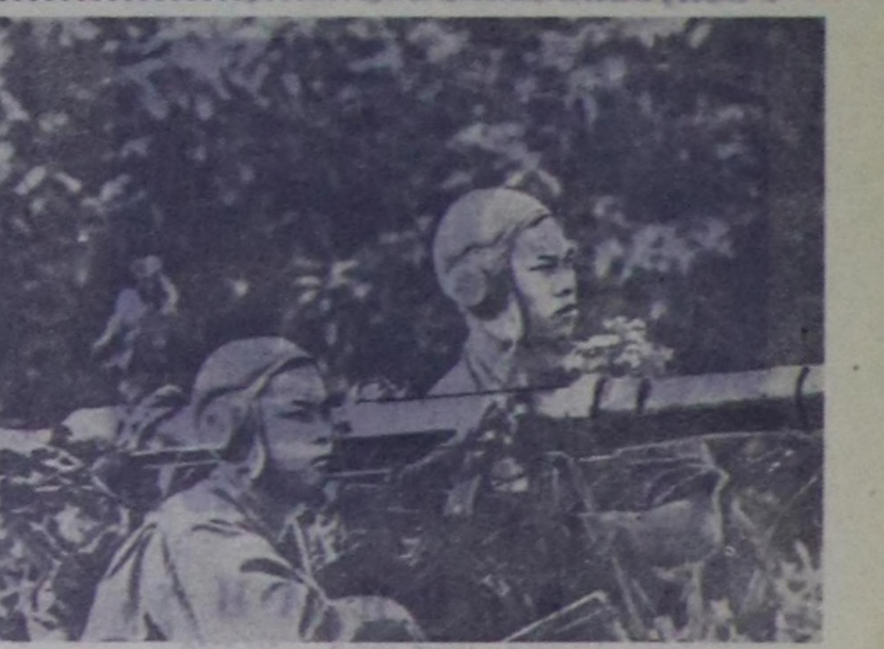
МУРНУУ ВЬЕТНАМ. Хосталга Армиязынын артиллержилери боолашкын шугумунда.

БАЙР. (СЭТА). Иордан хөмнин барымын аринде Иаблус хөөрайда бугу-нитинин ажил сокалышынын эгелзөн. Ираның эжелекчилер-биле кады ажилдыгынын күзө-вейи турар салгыжылар боттарынын салгыларын ажилды бөоринден ойталаан үезинде оларнын аш-чөм баранынын израиль эрге-чагыргалар-ның хавырын алганы ажил сока-